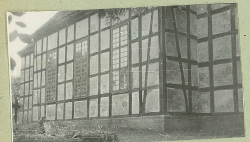
Fragment elewacji południowej