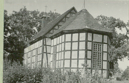
Widok ze Prezbiterium