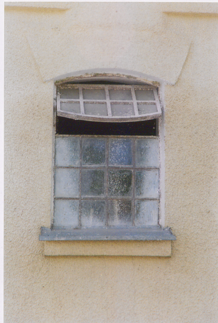
Okno w ścianie frontowej