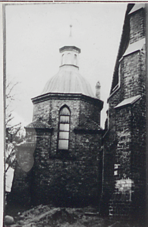
2. Kaplica kopułkowa od str. póln.