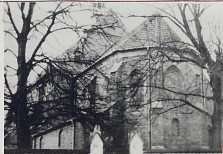
3. Elewacja wschod.