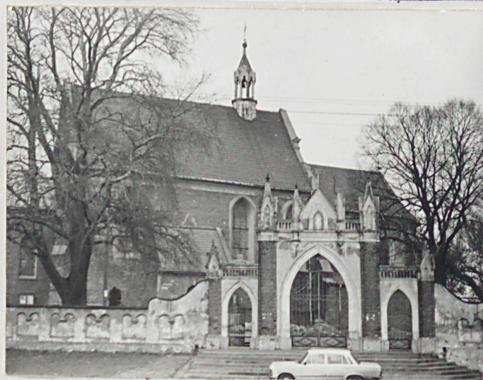
Elewacja frontowa południowa