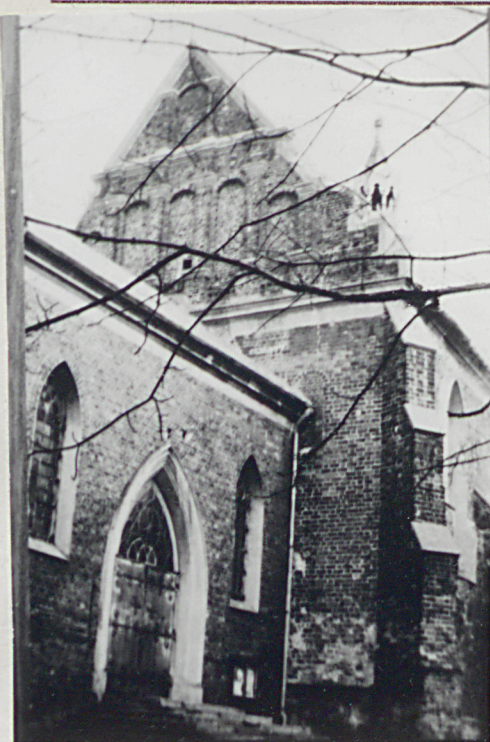
1. Portal w kruchcie głównej