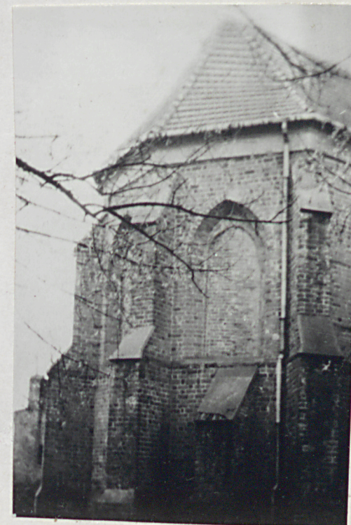
4. Zakończenie p. prezbiterium

Wkładkę założył: Piotr Dębicki (imię, nazwisko, data)