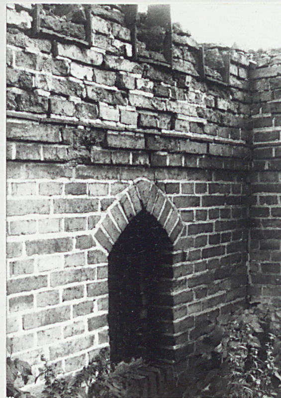
9. Okienko w murze zewnętrznym.