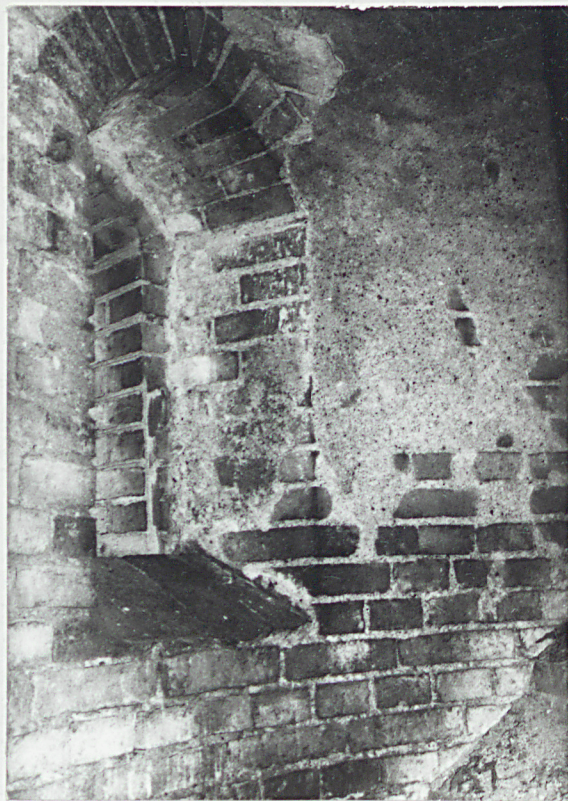
7. Otwór okienny w kształcie okna ostrołukowego.