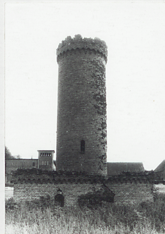
4. Elewacja północno-wschodnia. frontowa.