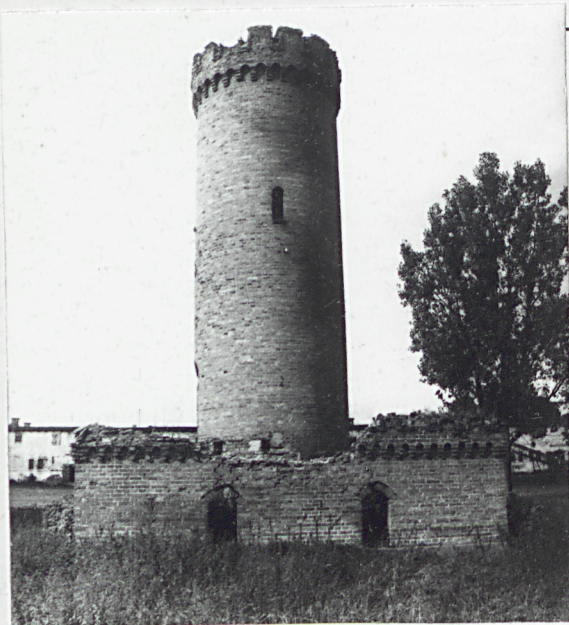
1. Elewacja boczna południowo-wschodnia. ORIENTACJA skal 1: 25 000