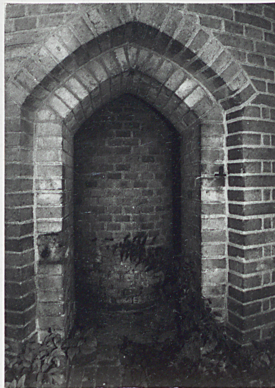
8. Otwór drzwiowy do wnętrza wieży.