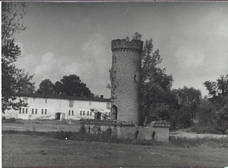
2. Gołąbnik widok na tle zabudowań podwórza folwarcznego. 3. Mur zewnętrzny elewacja zach.