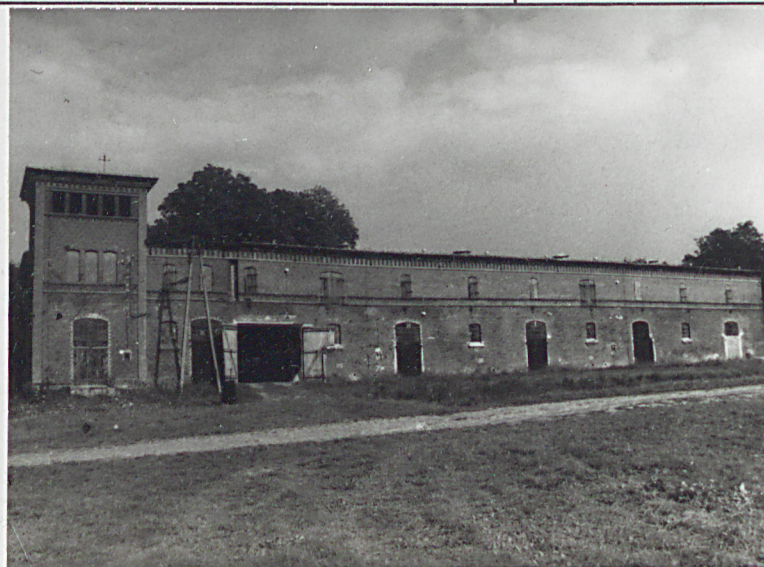
2. Elewacja frontowa-zachodnia. 3. Parter, wnętrze.