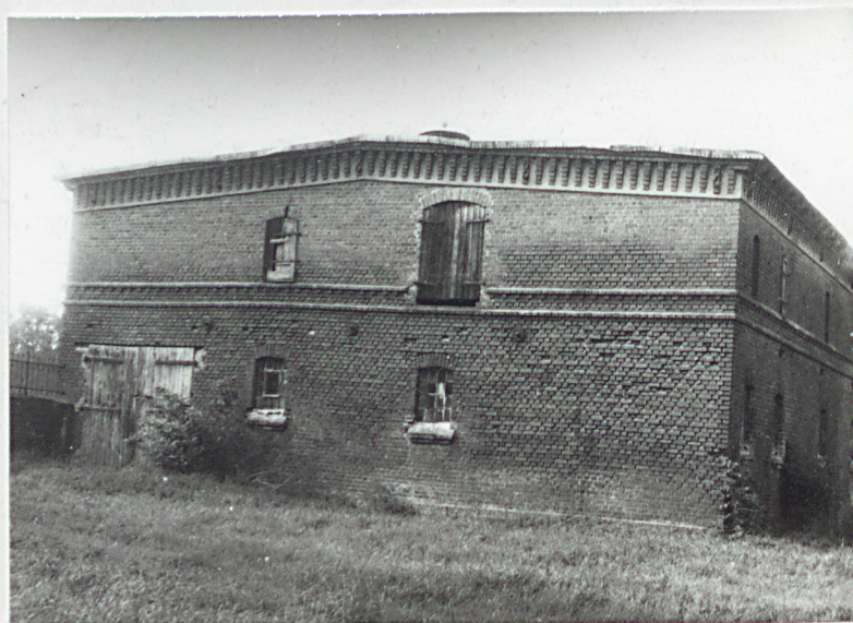
8. Elewacja zachodnia- wrota do piwnicy.