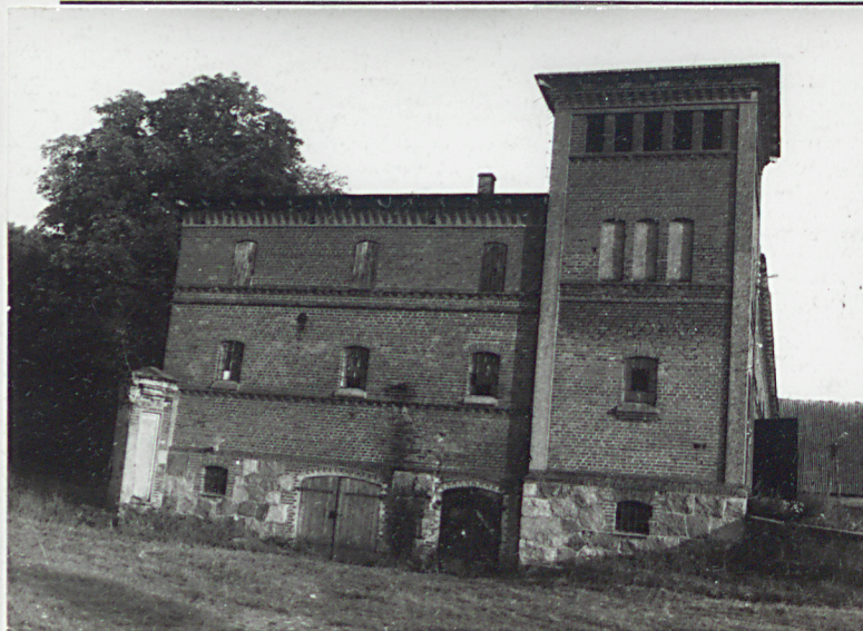
1. Elewacja boczna-północna. ORIENTACJA skala 1: 25 000