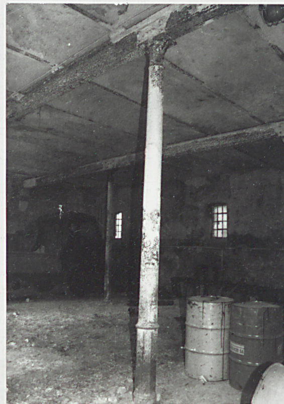
14. Parter, kolumna żeliwna.