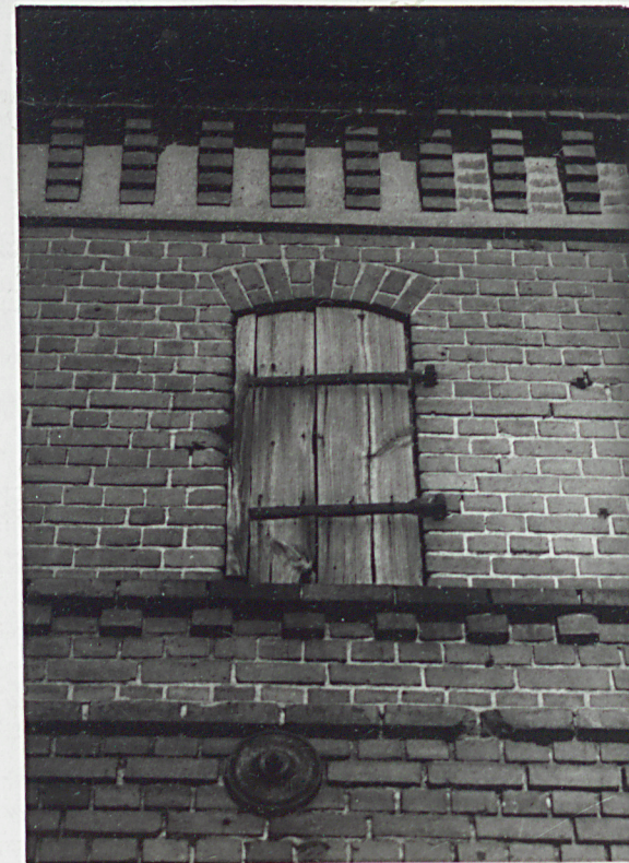
6. Elewacja frontowa, piętro.