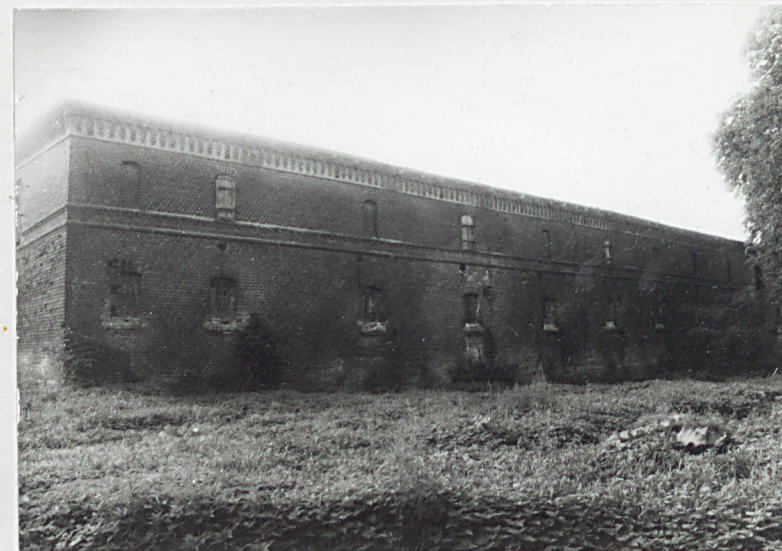
10. Elewacja tylna-wschodnia. 11. Piętro, wrota, elewacja północna.