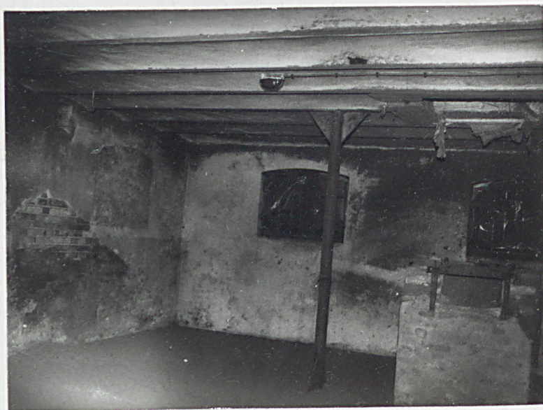
12. Parter, wewnątrz. 13. Poddasze.