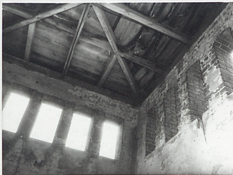
9. Wnętrze wieży, stropodach.