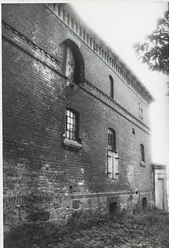
4. Elewacja tylna-wschodnia.