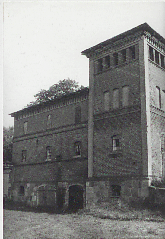
5. Elewacja boczna-północna.