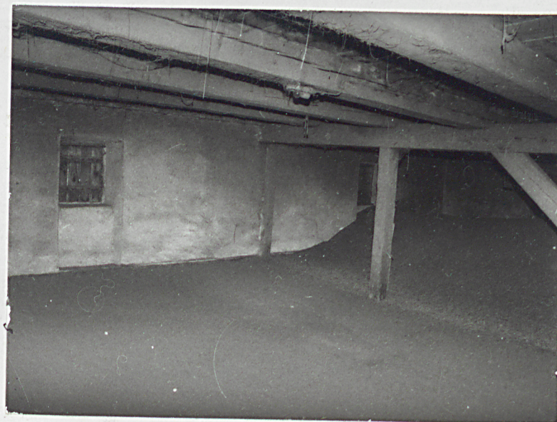
7. Wnętrze, piętro. 9. Okiennica okienna.