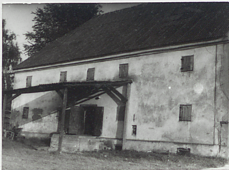
4. Elewacja frontowa.