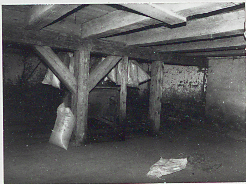
6. Wnętrze, parter. 8. Wnętrze, poddasze.