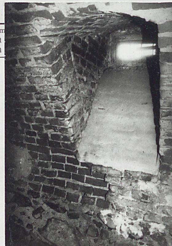
10. Otwór okna piwnicznego. 11. Ściana w piwnicy.