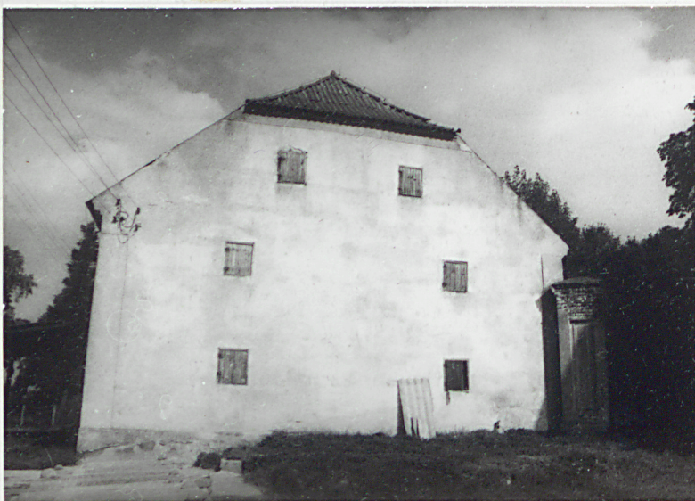
1. Elewacja szczytowa, zachodnia. ORIENTACJA skala 1: 25 000