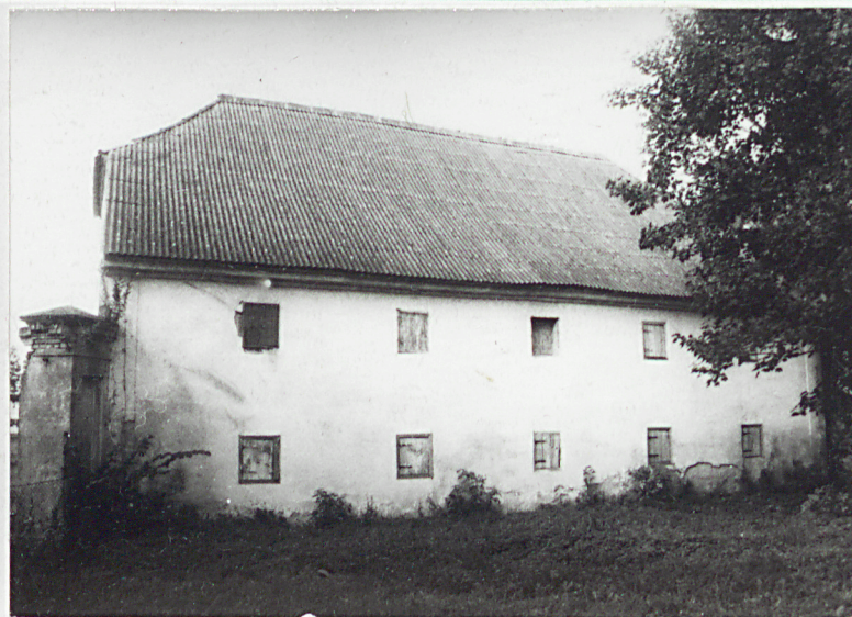
2. Elewacja boczna, południowa. 3. Piwnice.