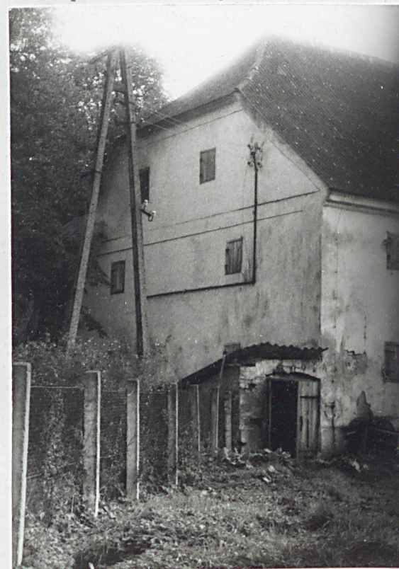
5. Elewacja szczytowa, wschodnia.