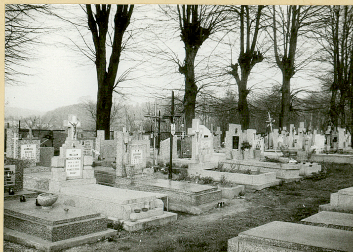
5. cmentarz w stronie wsch.