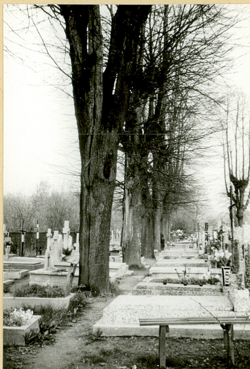
4. ciąg lip we wsch. str. cment.