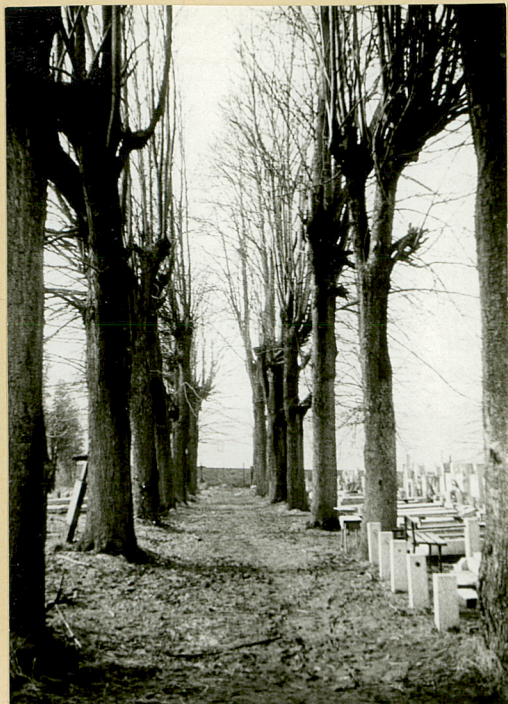
1. aleja główna na osi płn.-płd.