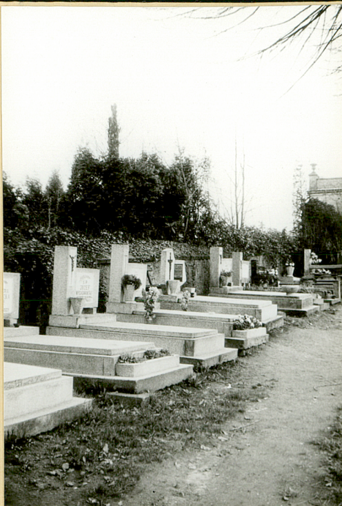
2. fragment cmentarza w partii pld.-wsch.