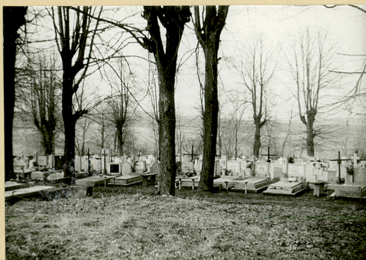
6.fragment komentarza w stronie pld.-wsch.