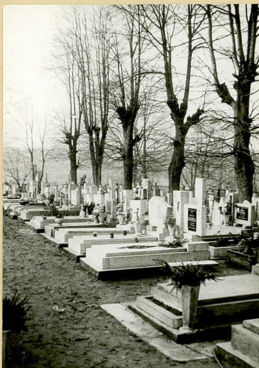
3. płn.-wsch. część cmentarza