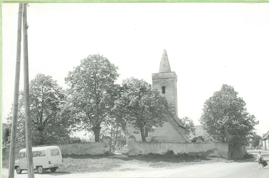
1. Widok ogólny