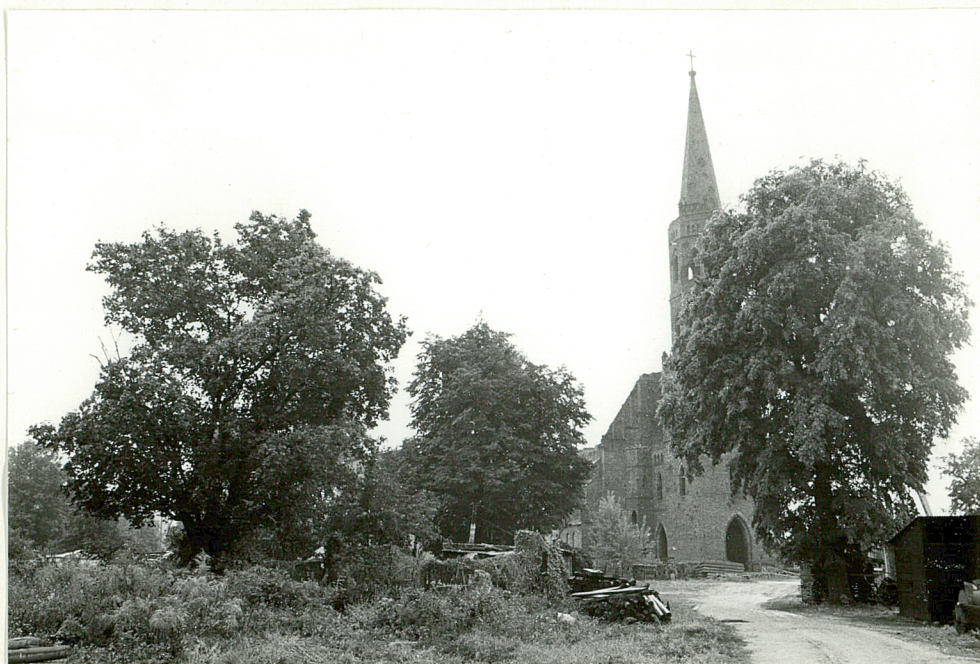
Pozostałości zieleni cmentarnej i widok kolegiaty od zachodu