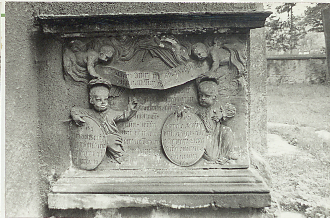
3. Epitafium piaskowcowe dzieci zm. 1701 i 1703