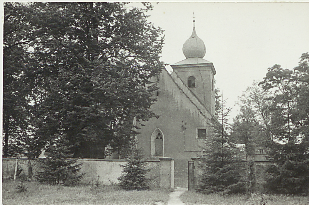
1. Widok ogólny od wschodu