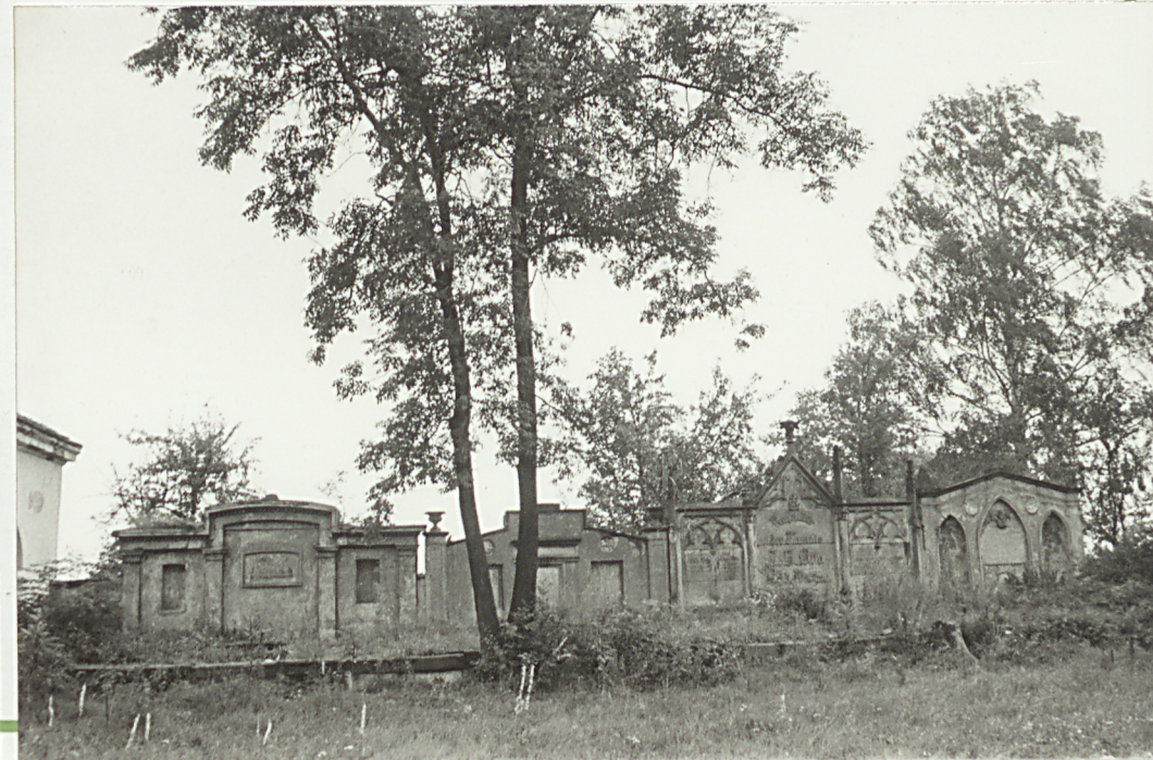
4. Nagrobki architektoniczne nad grobowcami.