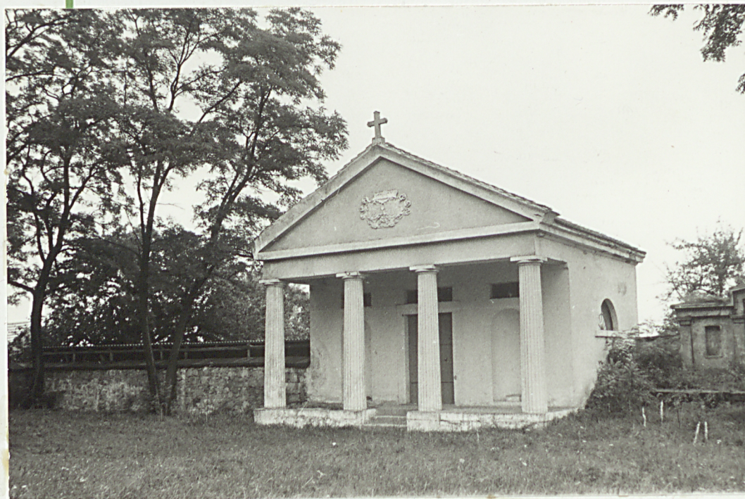
2. Mauzoleum N.N.