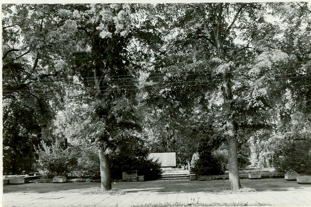
Grób nieznanego żołnierza.