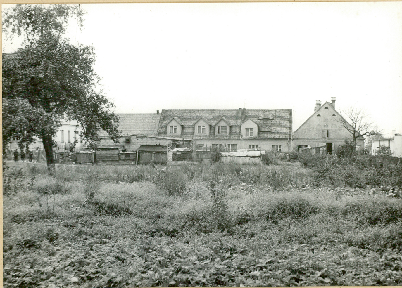
4. Lutomia Dolna. Ogrody warzywne, w głębi zabudowania folwarczne.