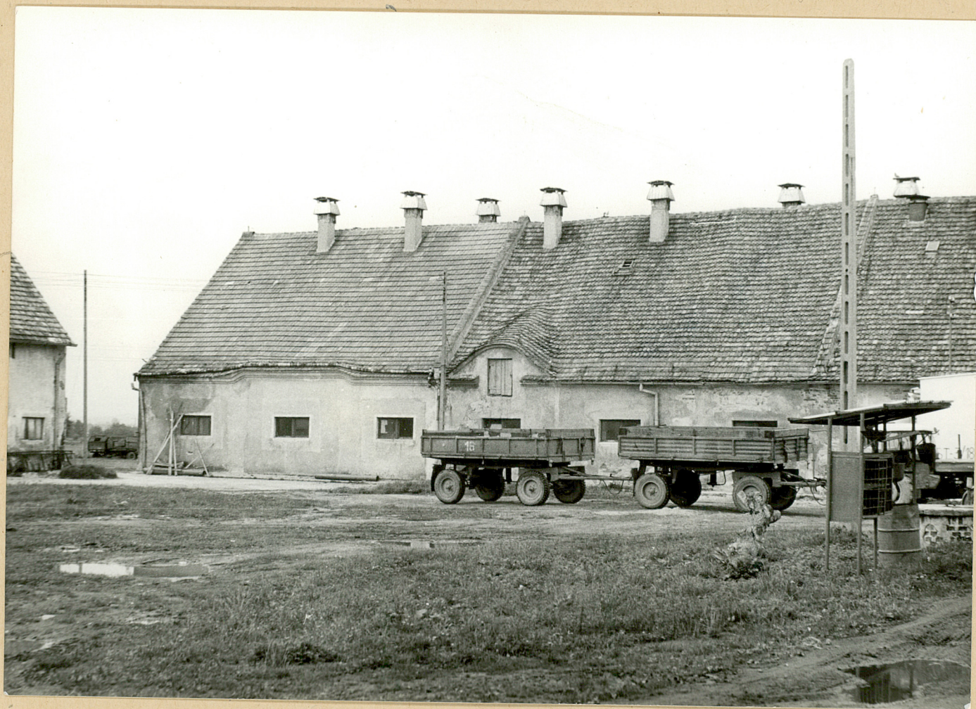
3. Lutomia Dolna. Północna część zabudowań gospodarczych.