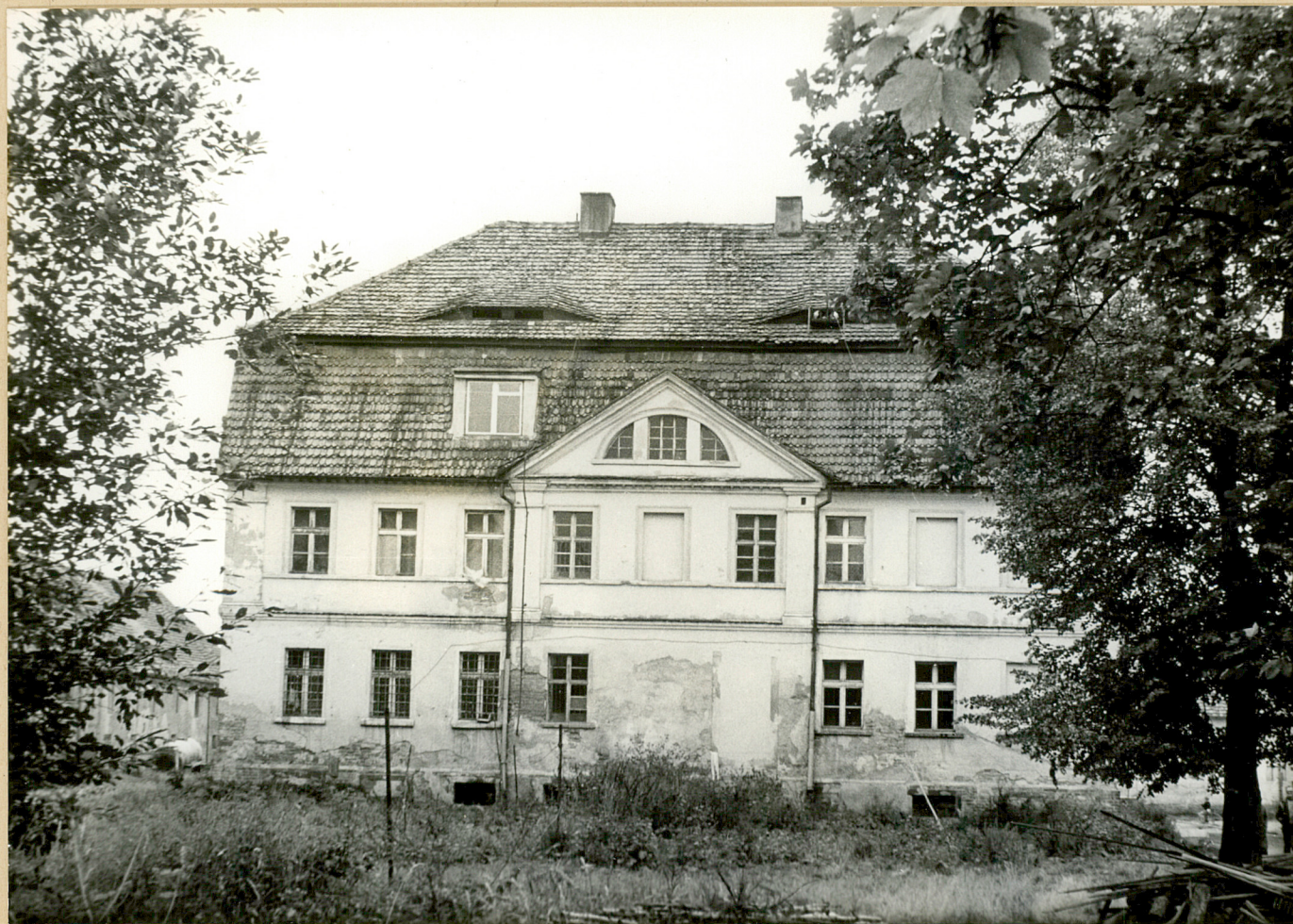
2. Lutomia Dolna. Pałac od strony południowo-zachodniej.