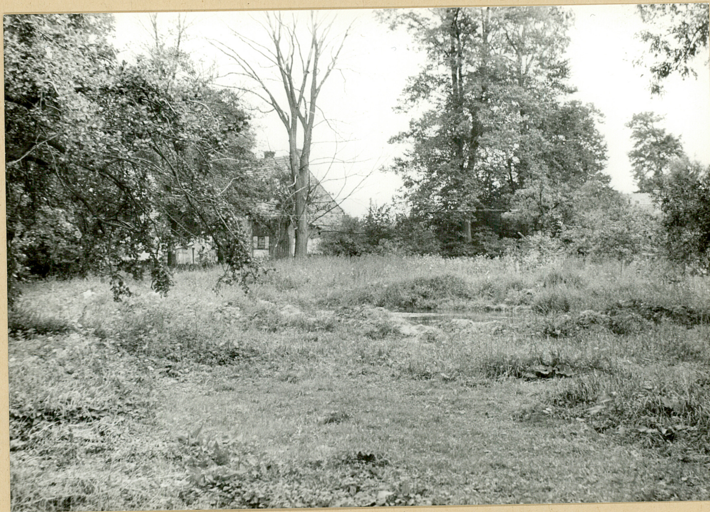
6. Lutomia Dolna. Widok na południowo-zachodnią część ogrodu.