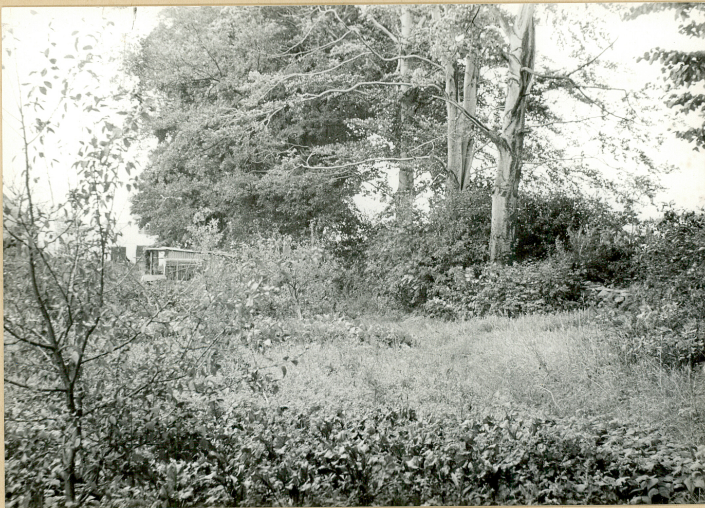
5. Lutomia Dolna. Południowo-wschodnia część parku.