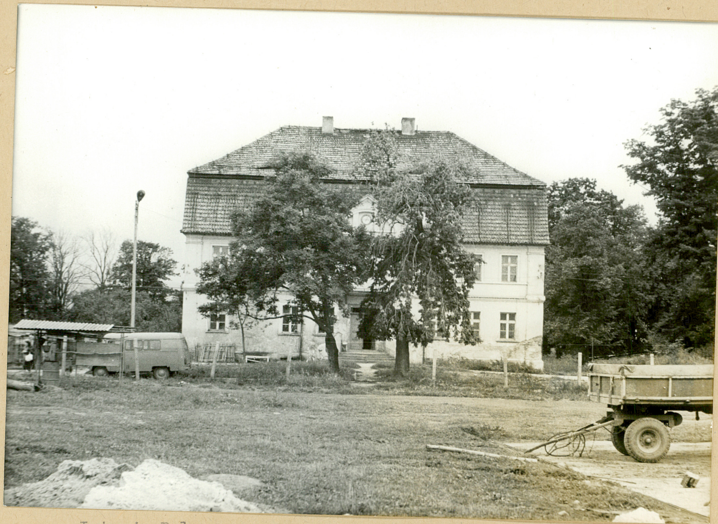
Lutonia Dolna. 1. Pałac od strony północno-wschodniej.