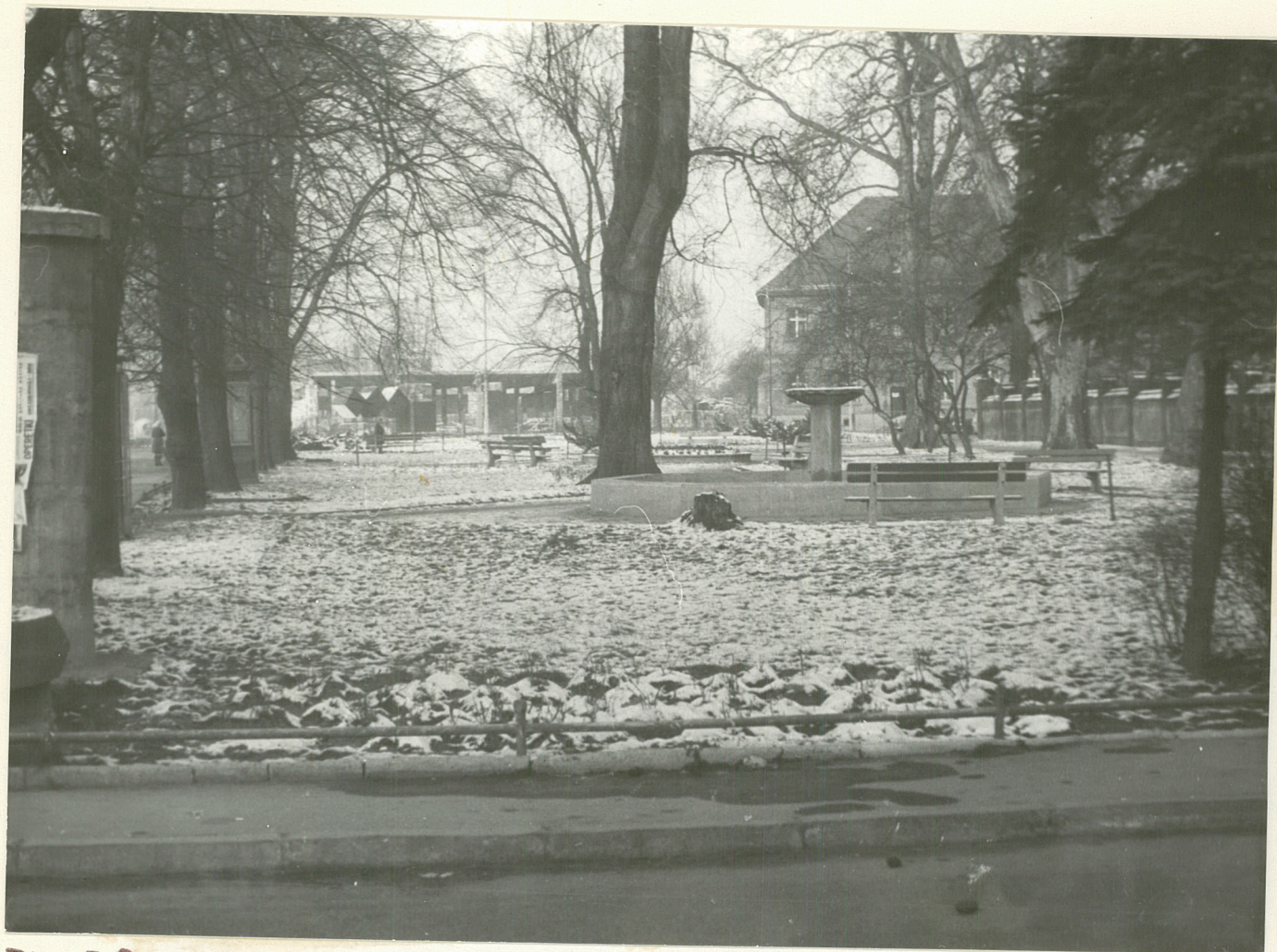
TRZEBNICA SKWER PRZY UL. WOLNOŚCI