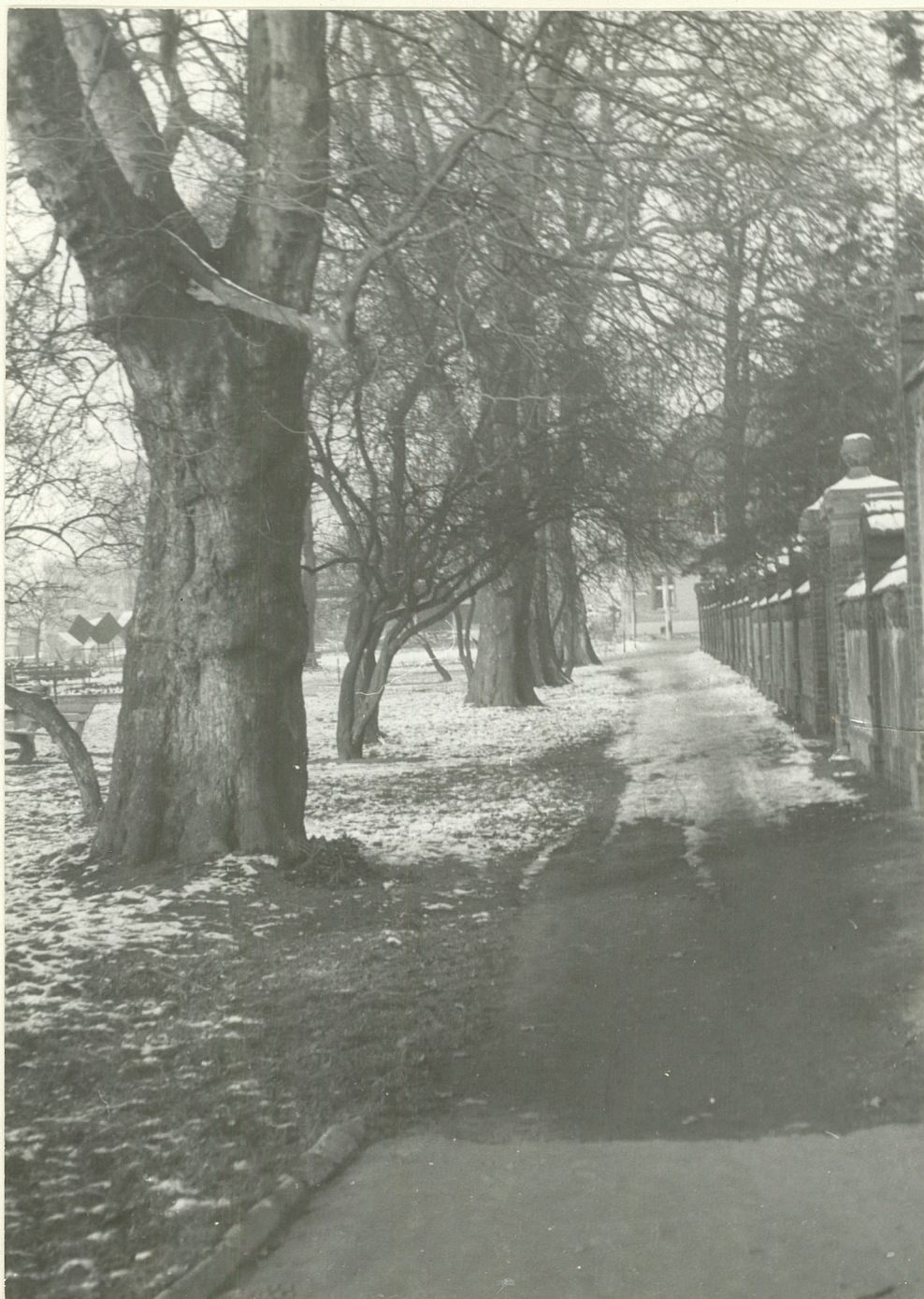
TRZEBNICA SKWER PRZY UL. WOLNOŚCI FOTO GRUDZIEŃ 77 ROK