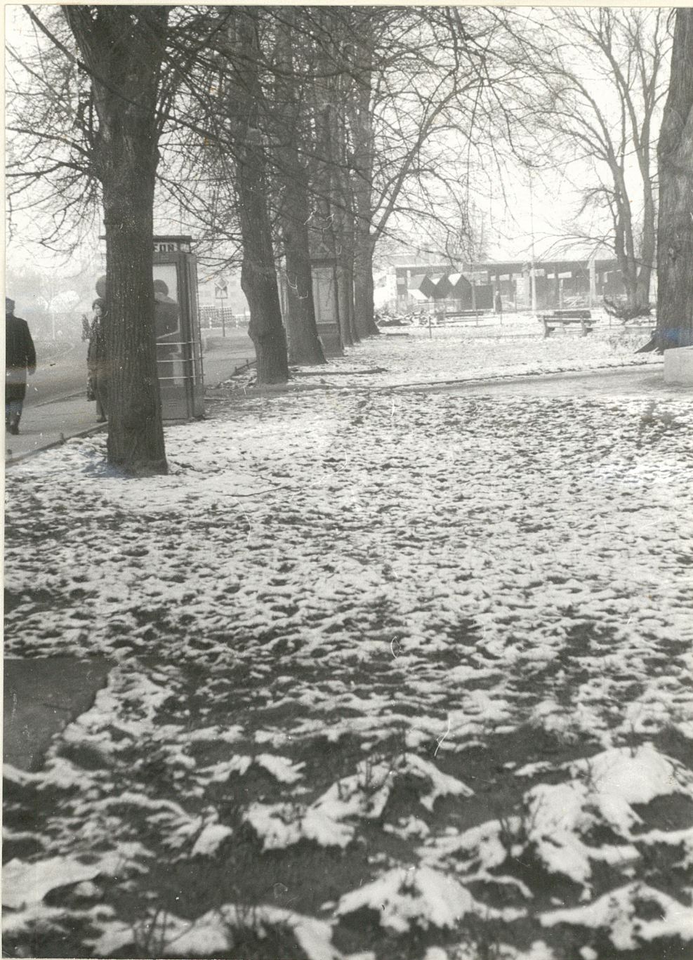
TRZEBNICA SKWER PRZY UL. WOLNOŚCI