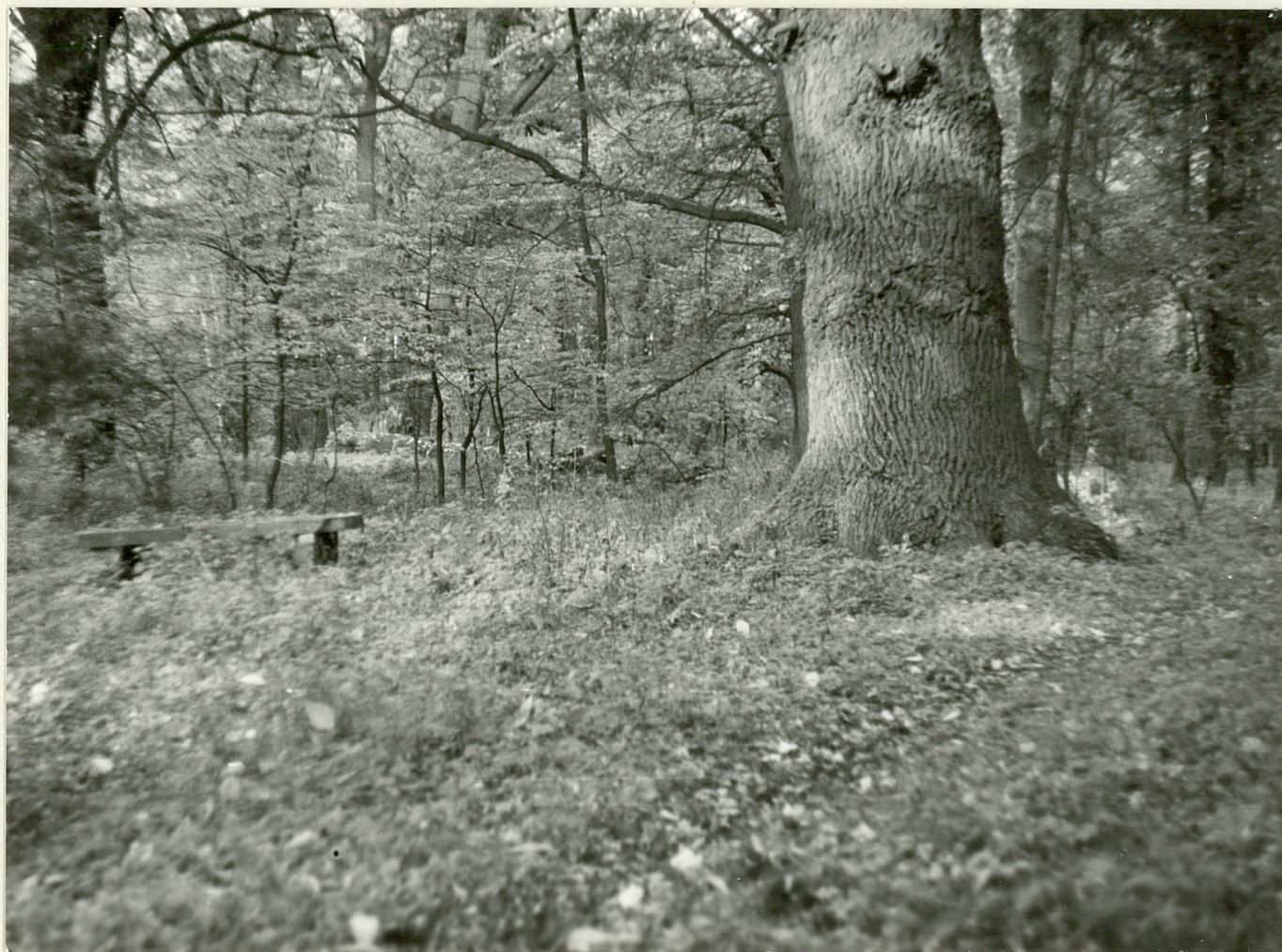
4. Stary dąb pomnikowy, po lewej stronie płyta nagrobkowa.