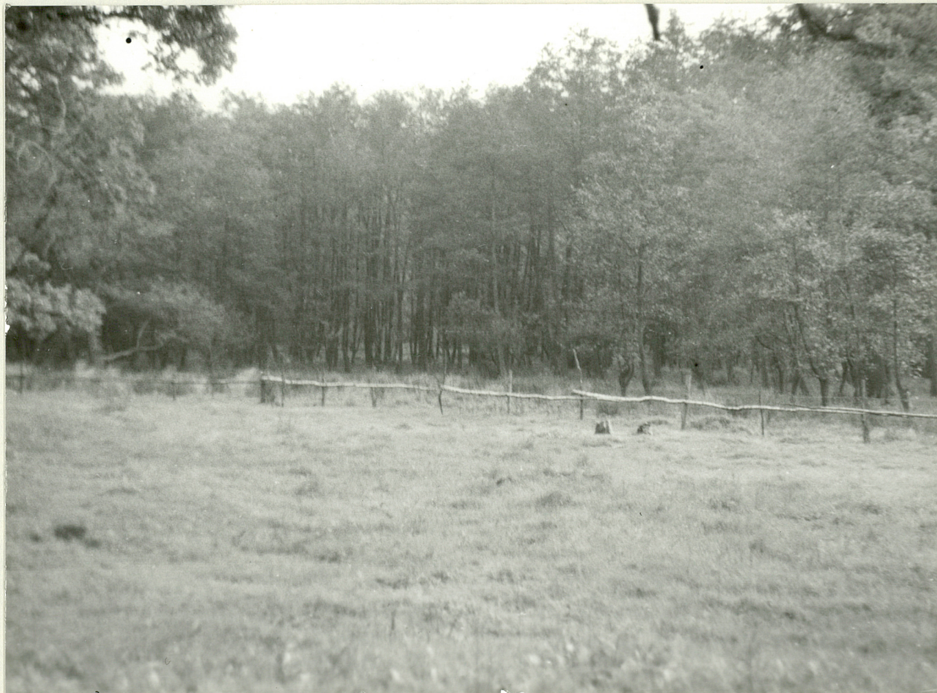
2. Łąka, w głębi las olszowy.