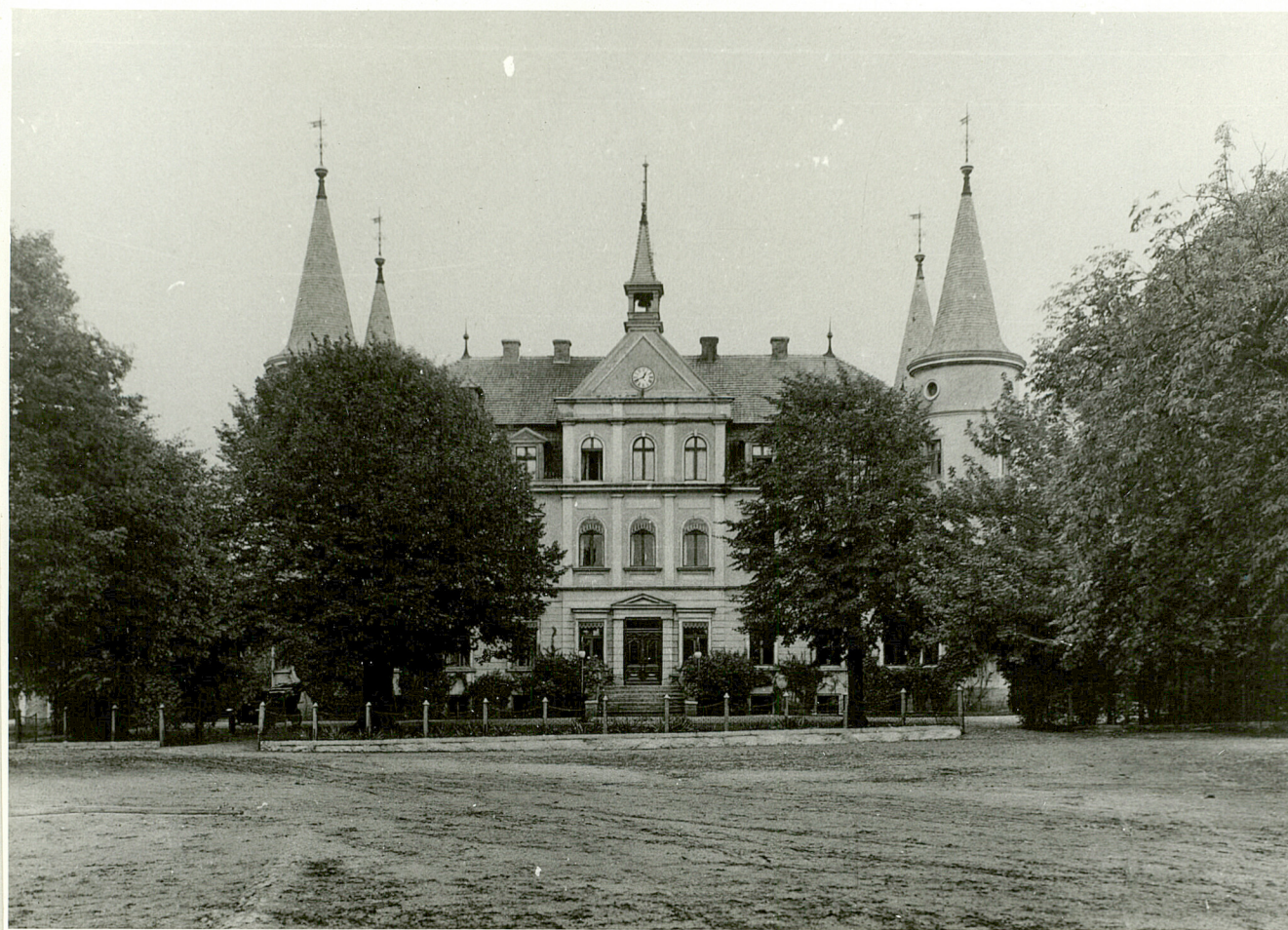
Widok pałacu z początku XX wieku, wg zdjęcia zawartego w albumie Webera.