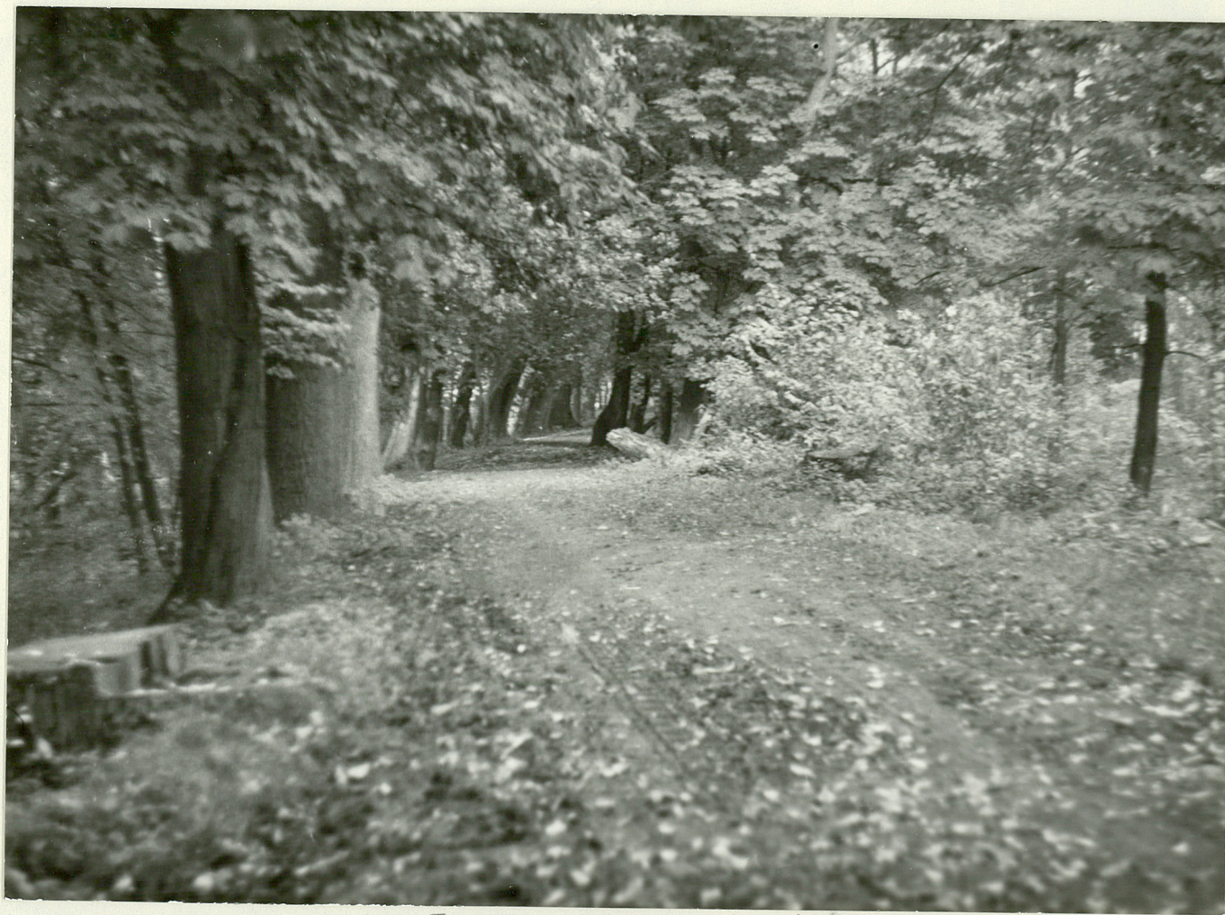
5. Fragment drogi, we wschodniej części obiektu.