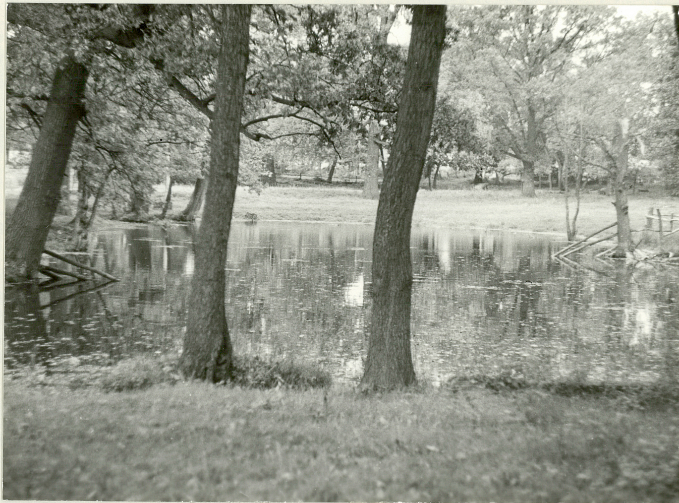
3. Stawek w parku,