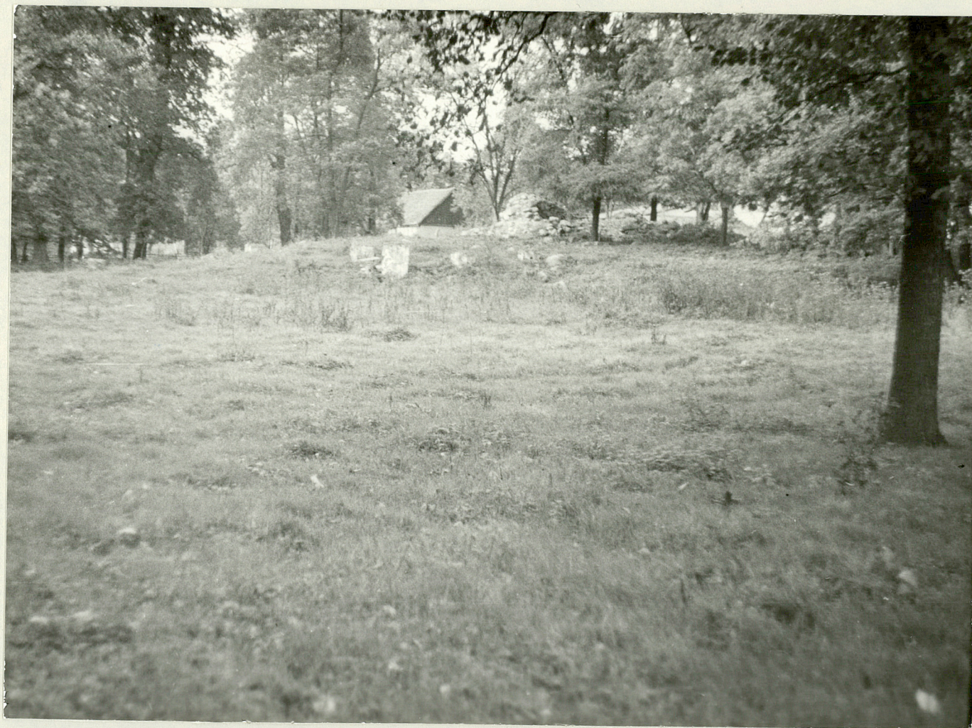
1. Polana przypałacowa.