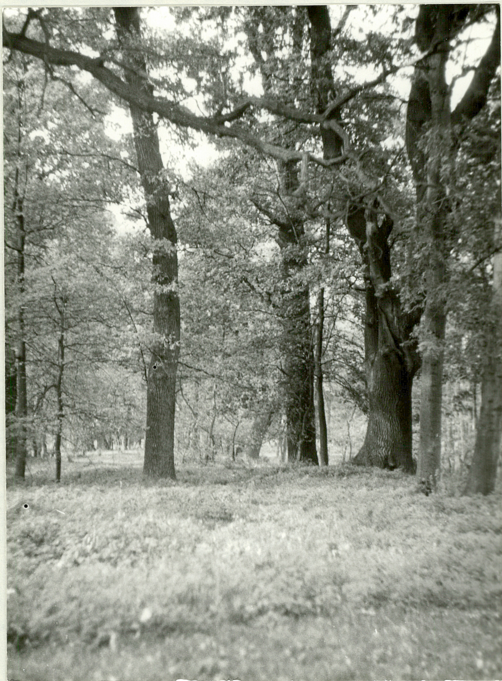
6. Grupa starych dębów.