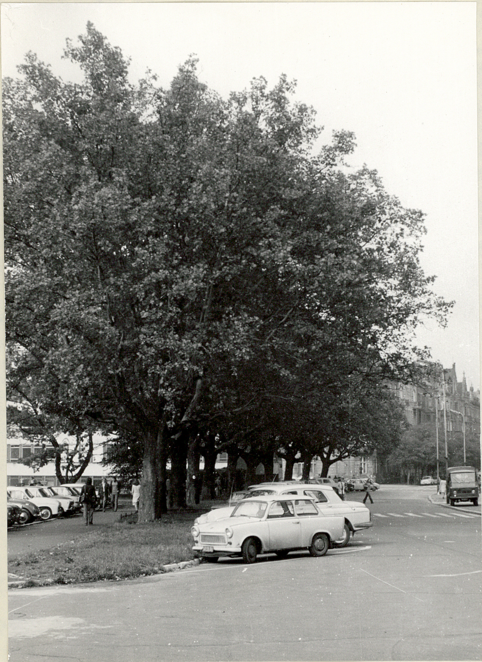
WROCLAW ul. Norwida