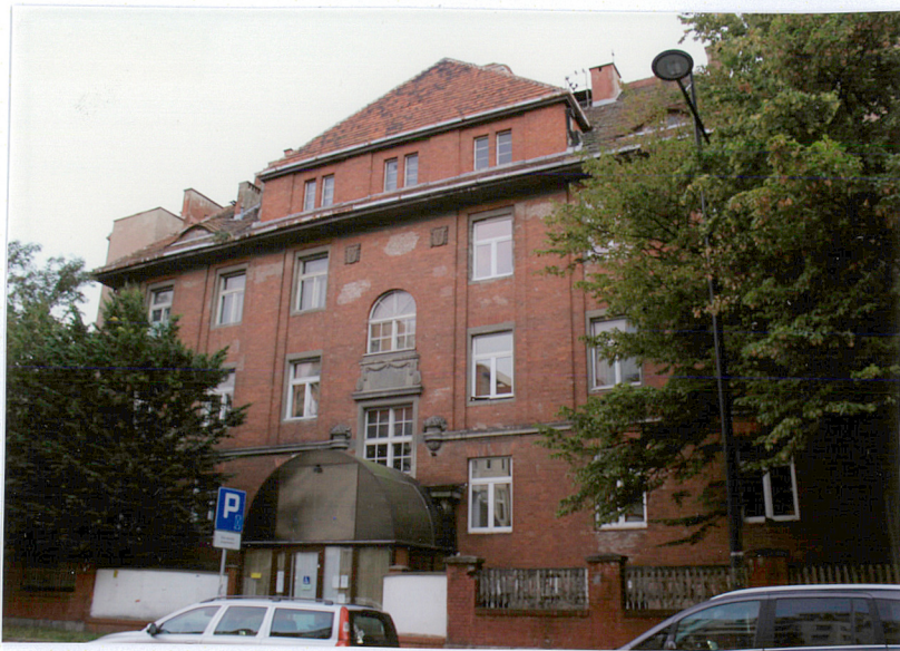
Budynek G, elewacja północna