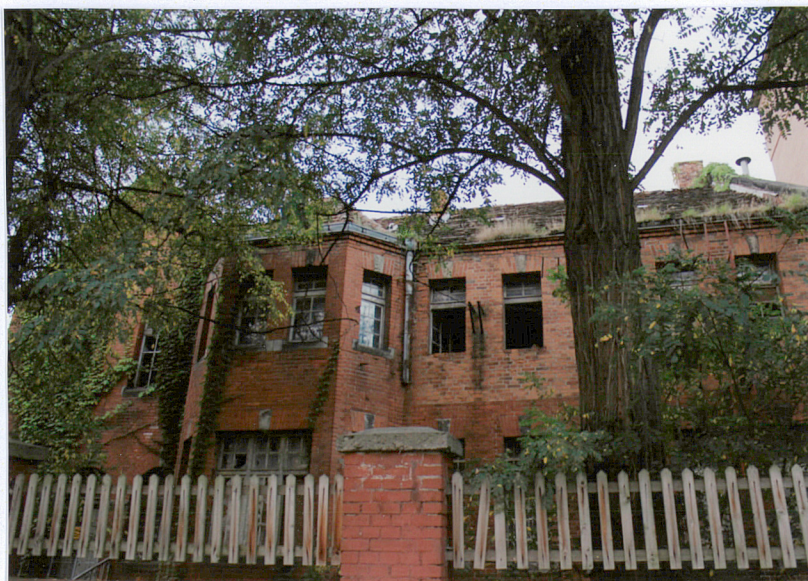
Budynek F, elewacja północna