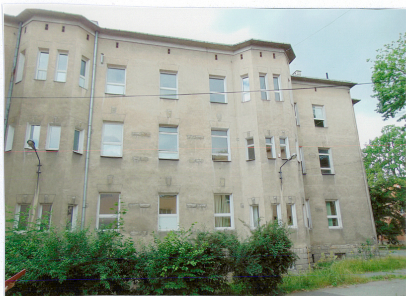
Budynek A, elewacja północna