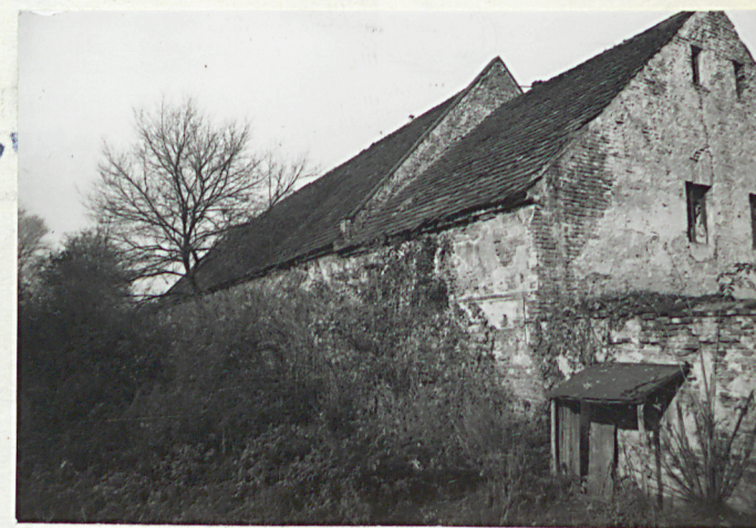
4.stajnia elewacja pd.