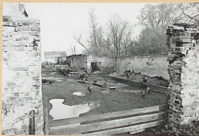
mur po wsch. stronie założenia