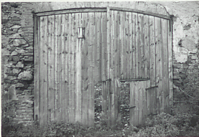
5. stodoła-wrota w elewacji pn.