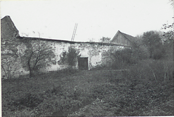
5. stodoła-elewacja pd.