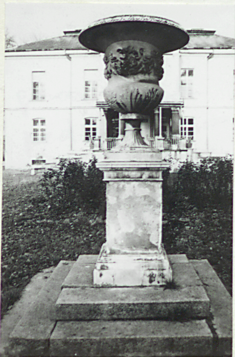
gazon w parku

4.STAJNIA-SPICHLERZ : 4 ćw.XiX w. Konstrukcja ceglana/cegła maszyn. w wątku holenderskim na zaprawie wapiennej/ze sklepieniami żagla- stymi /część zach./,wspartymi na granitowych kolumnach;sklepienia odcinkowe,ceglane,na stalowych belkach,wsparte na kolumnach sta- lowych/część zach. oraz przybud- ówka przy elewacji zach./.Konstrukcja krycia drewniana-płatwiowa, ze ścianą kolankową;dach 2-spad. kryty ceramicznie-dachówką karp. w podwójną łuskę.Posadzki betonowe, wylewane.Dolna kondygnacja podzie- lona na dwie części- zachodnia - krytą sklepieniami żaglastymi w układzie 3-nawowym/nawa środk. węższa/oraz wschodnia :jednoprze- strzenną,ze sklepieniami odcin- kowymi,biegnącymi poprzecznie, wspartymi na stalowych kolumnach. Wschodnia przybudówka o identycz. konstrukcji co wsch część budynku.