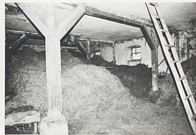
wnętrze "III" od zach.