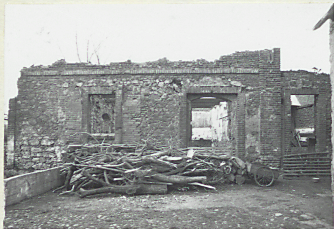
7. stajnia-elewacja wsch.