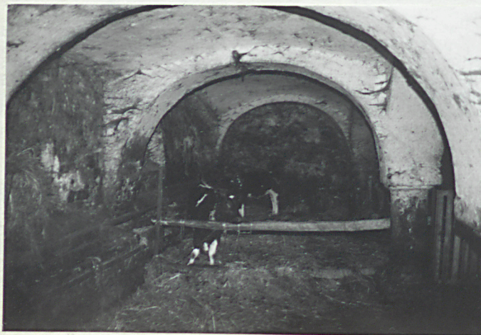
wnętrze zach. części -nawa pd.