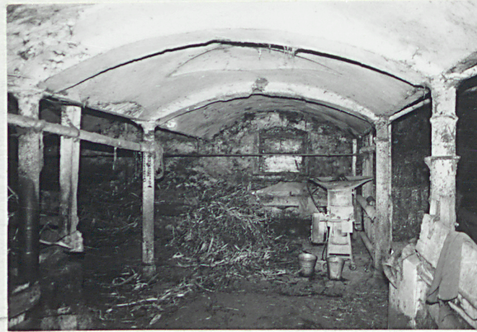
wnętrze wsch. części budynku