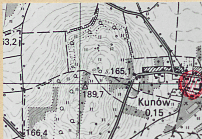
orientacja, skala 1:25 000