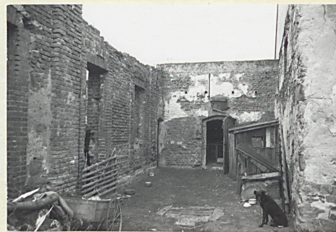
narożnik pn.- zach. podwórza