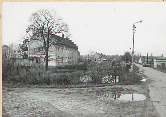
skrzydło pn. założenia-widok z zewn.ątrz