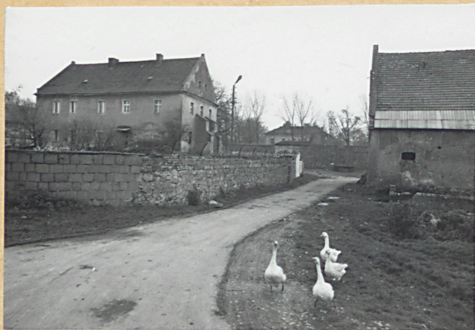
brama pn.-zach. założenia