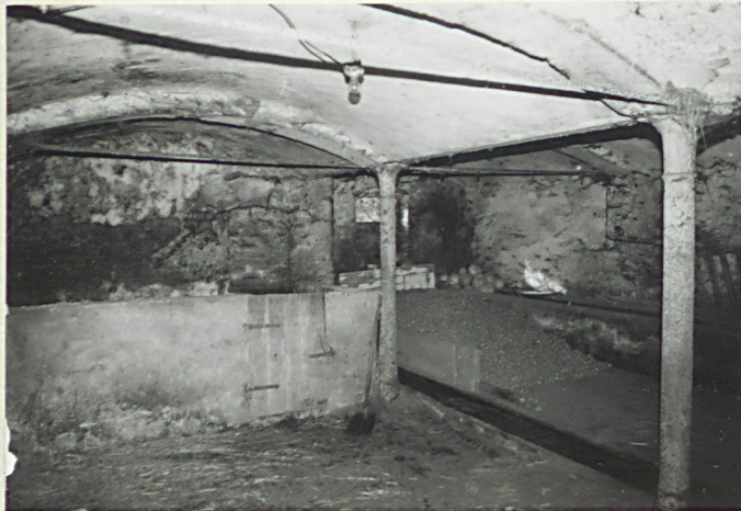
wnętrze przybudówki /wsch/

Budynek o konstrukcji mieszanej -kamień polny i łamany o raz cegła na zaprawie wapiennej; cokół kamienny. Konstrukcja dachu zniszczona /pierwotnie-płatwiowa na 2 rzędy słupów, dach był 2-spadowy, kryty ceramicznymi dachówkami-karpiówkami w podwójną łuskę/. Budynek był podzielony na 2 części. Budowla spłonęła pod koniec lat 70-tych.