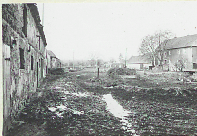
wódek na zach. część podwórza