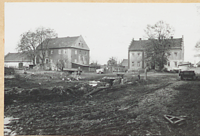
pn. skrzydło -widok od podwórza