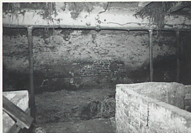
wnętrze "IV" od zach.