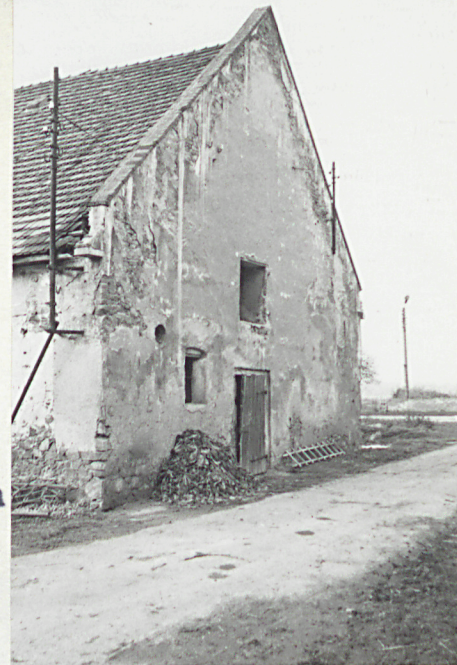
elewacja wsch. elewacja zach.

Budynek o fundamentach kamiennych, ciągłych; konstrukcja murów-murowana, kamienna/dolna kondyg./oraz ceglana /górna kondyg-poddasze -cegła maszynowa na zaprawie wapiennej w wątku holenderskim. Sklepienia żaglaste, ceglane stropy drewniane-kryte, stropy drewniane, gęstobelkowe, wsparte na stalowych kolumnach. Konstrukcja dachu drewniana-płatwiowa na 2 rzędach słupów, ze ścianą kolankową; dach 2-spadowy, kryty ceramicznie-dachówką-karpiówką w podwójną łuskę. Wnętrze budynku podzielone na cztery zasadnicze części: I/od zach./-sklepione żaglasto /2 połę sklepienne, II-przykryte stropem drewnianym gęstobelkowym, III -największe pomieszczenie-kryte stropem drewnianym, krytym, wspartym na drewnianych słupach, IV-kryte stropem drewnianym, gęstobelkowym, wspartym na stalowych kolumnach. Wejścia do 3 pierwszych pomieszczeń w elewacji pd., do czwartego w elewacji wsch.