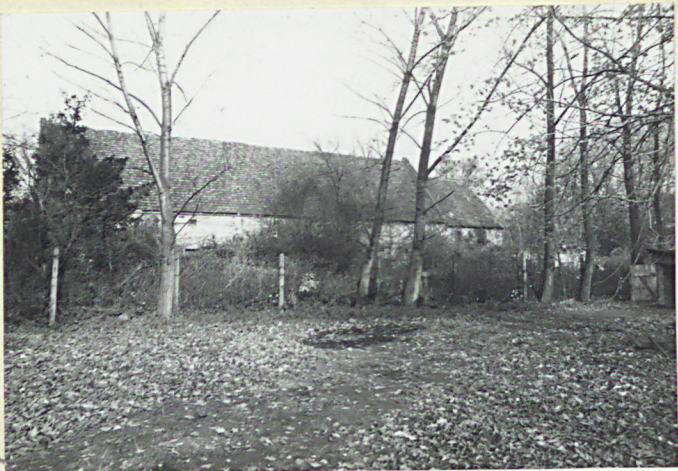
widok od dworu II/9/ w kier. folwarku