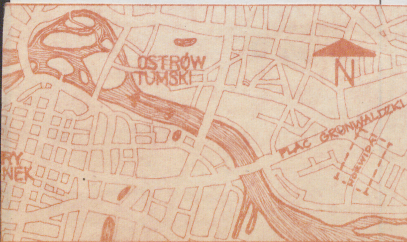
Usytuowanie ul. Norwida wobec centrum

Budynek wyposażony we wszystkie instalacje - elektryczną, gazową, Wod-kan. Ogrzewanie wewnątrz piecami, Częściowo etażowe.