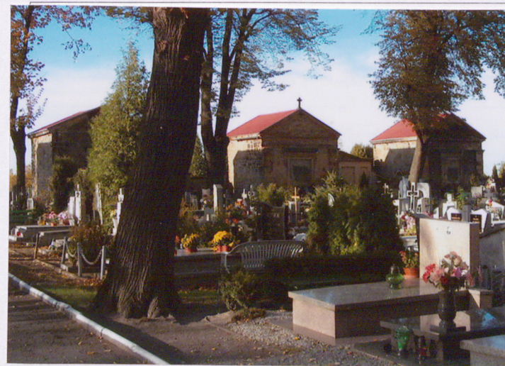
Aleja z mauzoleami widok od wschodu - mauzolea (6, 7, 8)