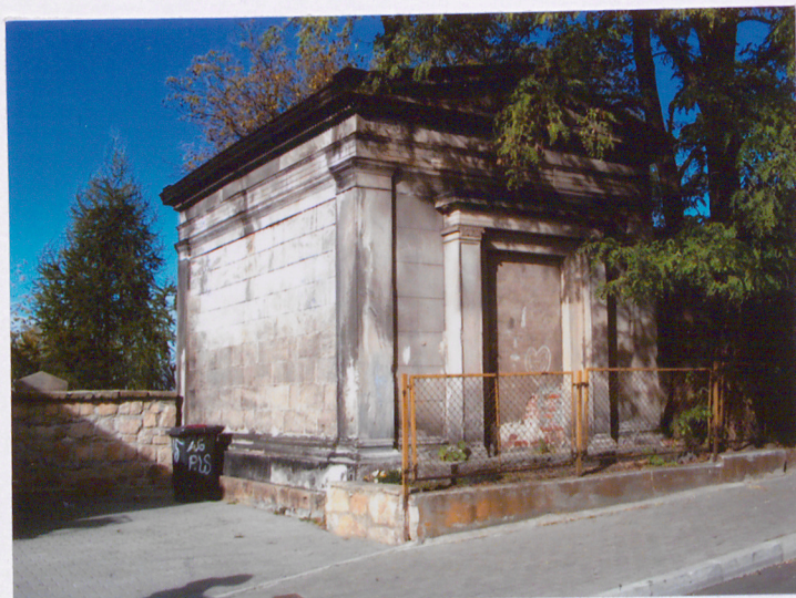
Mauzoleum (15) – XIX w. Rodzina nn.

Zlokalizowane po lewej stronie głównej bramy prowadzącej na cmentarz.