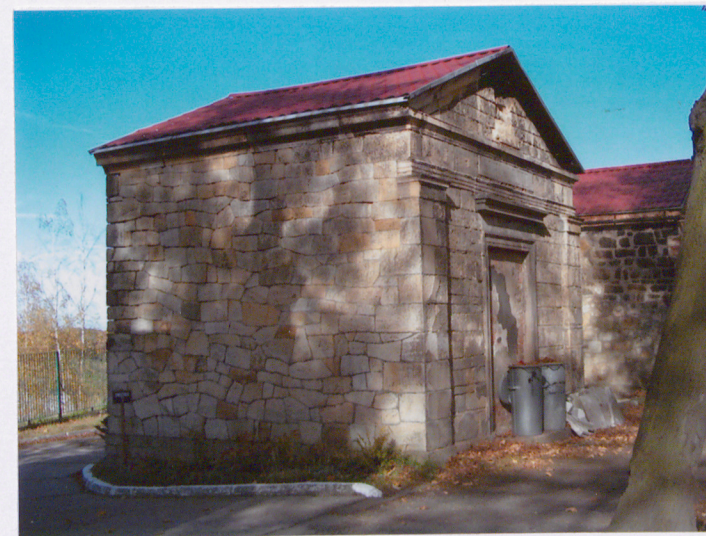
Mauzoleum (6) – XIX w. Rodzina nn.

Obiekt zabezpieczony, wejście zamurowane. Mury w stanie dobrym, piaskowiec pokryty warstwami zanieczyszczeń atmosferycznych – zszarzały, miejscami odsłonięta pierwotna żółta barwa. Ubytki w detalu architektonicznym (ślady po mechanicznych uszkodzeniach).