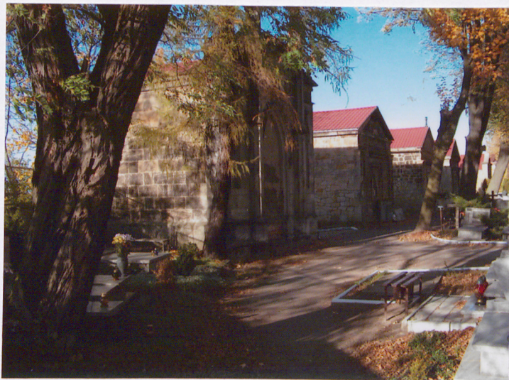
Aleja z mauzoleami widok od południowego wschodu - na pierwszym planie mauzoleum (5)