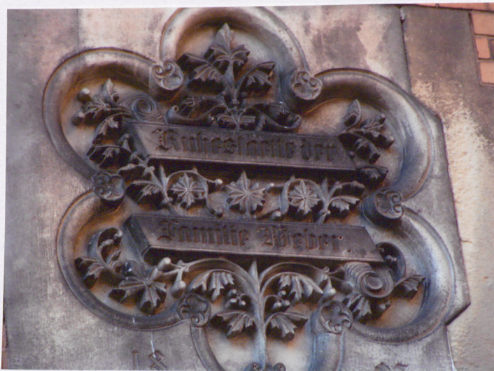
Kartusz mauoleum rodziny Lieberów, mauzoleum (12)