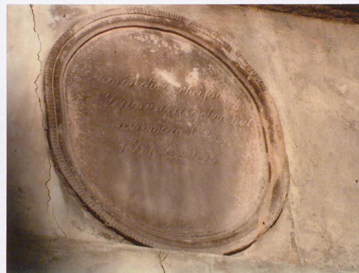
Medaliony z mauoleum rodziny Schubertów, mauzoleum (14)