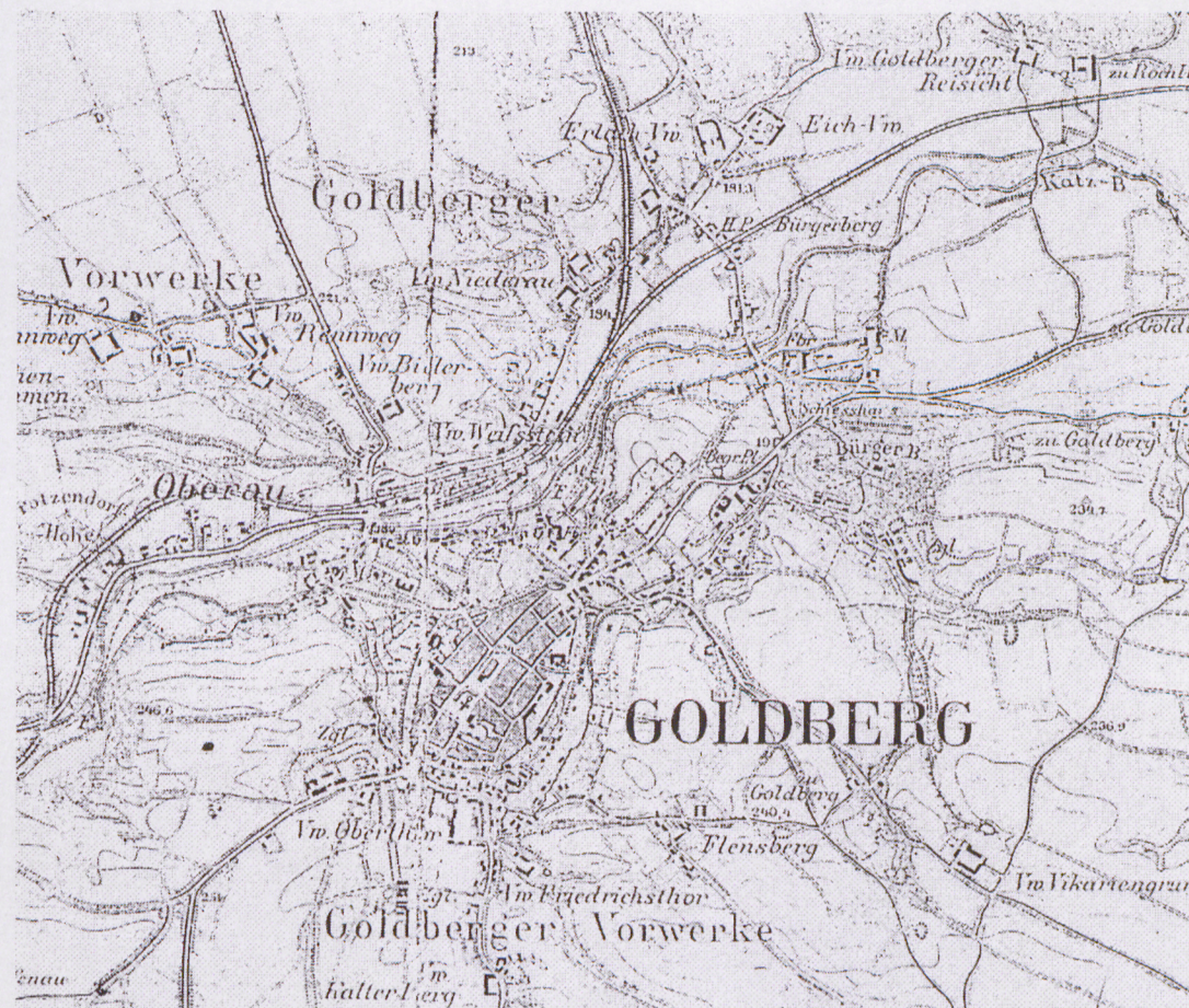
ryc. II Fragment mapy w skali 1:25 000, pomiar 1886, wyd. 1934