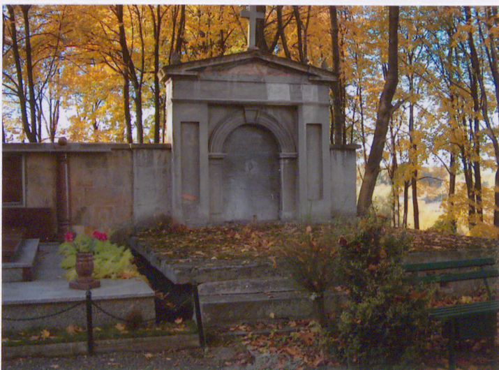
Mauzoleum (13) – XIX w. Rodzina nn.

Mauzoleum przylegające do muru otaczającego kwatery, opracowane w formie płytkiej ediculi zwieńczonej frontonem z prostym belkowaniem i trójkątnym, oprofilowanym tympanonem zwieńczonym krzyżem. Murowane z cegły, tynkowane. Detal architektoniczny wyrobiony w tynku. Na osi frontu okrągłoluczny portal z profilowaną archiwoltą i kluczem. Miejsce na dodatkowe płyty nagrobne u podstawy mauzoleum, podwyższone o trzy stopnie w stosunku do poziomu gruntu.