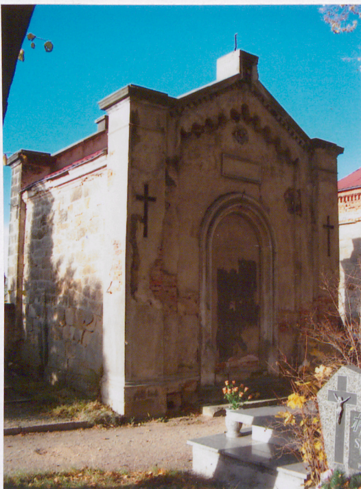
Mauzoleum (9) – XIX w. rodzina Gottschlingerów

Obiekt założony na planie czworoboku, murowany z piaskowca (lewa ściana) i cegły (prawa ściana i fronton), tynkowany. Fronton flankowany narożnymi, masywnymi pilastrami, ujęty w lizeny tworzące stylizowany fryz arkadkowy, zwieńczony trójkątnym szczytem ze słupkową odsadzką. Na osi frontonu okrągłoluczny, wysoki portal w pół i ćwierćwałkowo profilowanej opasce. Ponad portalem prostokątna plakietka ze szczątkowo zachowaną inskrypcją Gottschlinger i płaskorzeźbionym tondem z uskrzydłą główką ( Thanatos ). Szczyt frontonu podkreślony stylizowanym fryzem arkadkowym i gzymsem kostkowym, zwieńczony profilowanym schodkowo gzymsem.