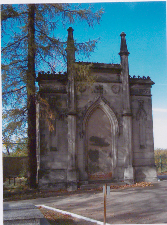
Mauzoleum (5) – 1881, rodziny Schmallerów.

Obiekt założony na planie czworoboku, murowany z jasnego piaskowca, zaprojektowany w stylu neogotyku angielskiego. Ostrołukowy portal na osi fasady flankowany jest przez wieloboczne kolumny z profilowanymi przewiązkami kapiteli, przechodzące w smukłe pinakle wieńczące attykowe nadproże portalu. W nadprożu dwa medaliony ze stylizowanymi literami S i inskrypcją Ruhestette Familie Schmaeller . W bocznych ściankach po obu stronach portalu, znajdują się wąskie ostrołukowe nisze zwieńczone wimpergą. Repertuar form dekoracyjnych i ich kompozycja (kwiatony, żabki, plecionki, pinakle, floralne fryzy, sterczyny) nawiązuje dość swobodnie do późnego gotyku.