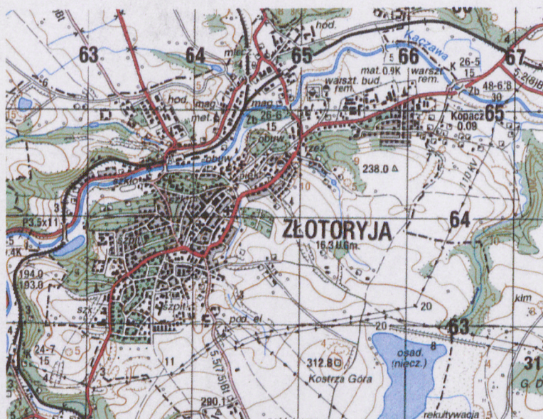
ryc. II Fragmenta mapy w skali 1:50000