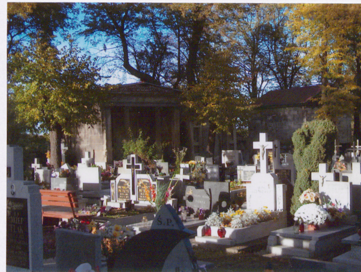
Aleja z mauzoleami widok od wschodu - mauzolea (2, 3, 4)