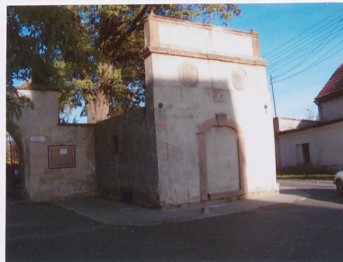
Mauzoleum (14) – XIX w. rodzina Schubertów.

Mury w stanie dobrym, miejscowe odspojenia tynków. Ubytki w dekoracji belkowania i tympanonu.