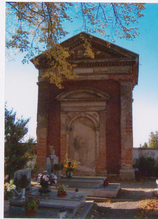
Mauzoleum (10) – XIX w. Rodzina nn

Obiekt zabezpieczony, wejście zamurowane. Miejscowe uszkodzenia ceglanego muru, erozja piaskowca, znaczne powierzchnie uszkodzeń i ubytków tynków. Dach pokryty nową, czerwoną blachodachówką, wyrwane opierzenia blacharskie.