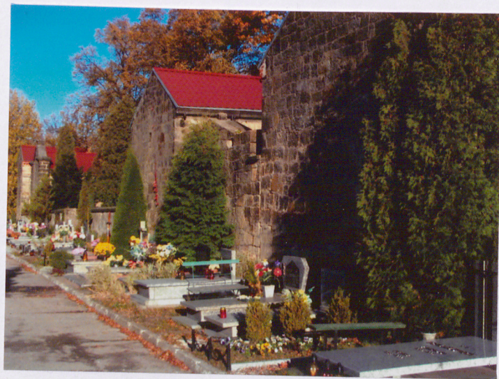
Aleja z mauzoleami widok od południowego zachodu - na pierwszym planie mauzoleum (6)