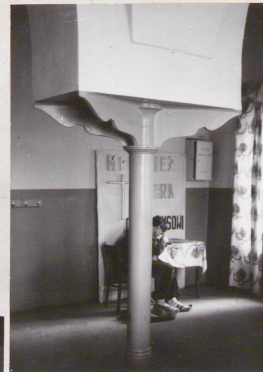
fot.14 kolumna żeliwna w po- mieszczeniu w narożniku północno-zachodnim