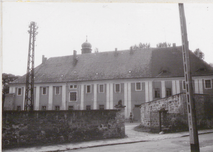
fot.4 elewacja północna- widok z ul. Klasztornej