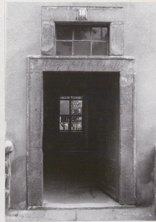
fot.11 portal wejściowy w elewacji zachodniej