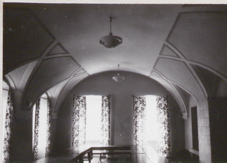
fot.13 wnętrze sali w narożniku płn-wschodnim