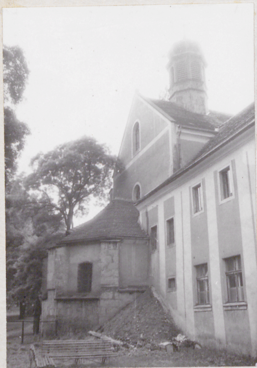
fot.8 fragment elewacji wschodniej i prezbiterium kościół z zakrystią