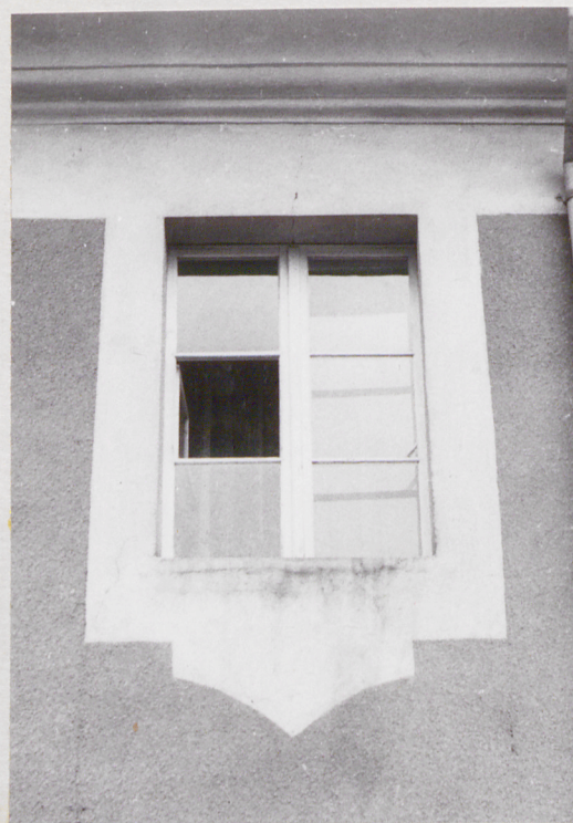
fot.9 okno 1.piętra w pld. części elewacji zachodniej