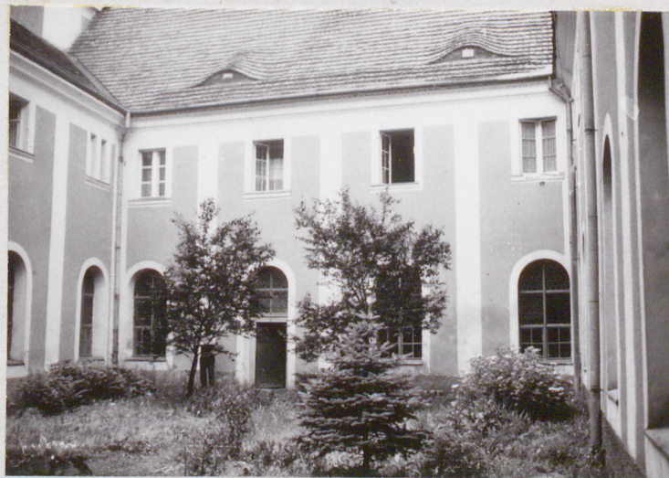
fot.6 wnętrze wirydarza- widok na ścianę zachodnią.