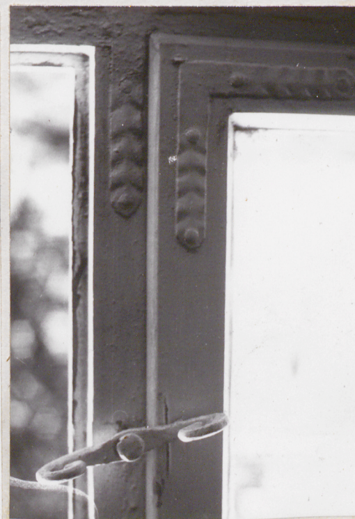
fot.15,16 stolarka okienna w krużganku