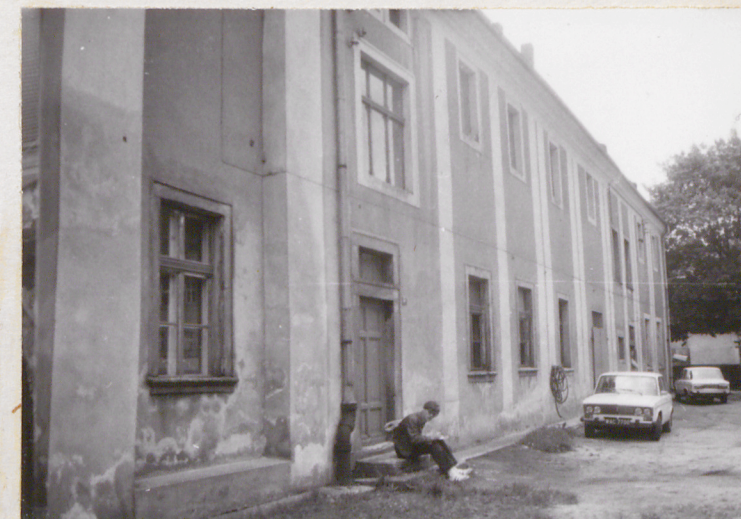
fot.5 elewacja północna