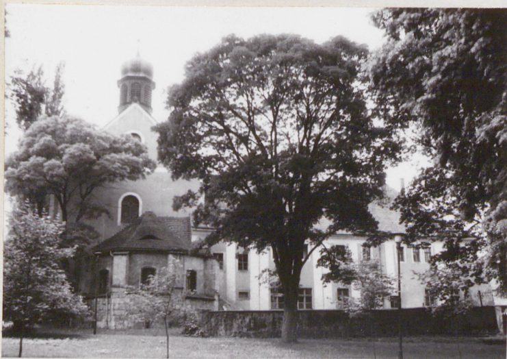
fot.3 widok klasztoru i kościoła od wschodu