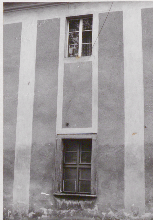
fot.10 fragment pñ. części elewacji zachodniej