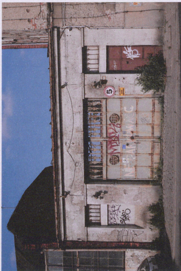
1. Brama, widok od zachodu, fot. 05.2018