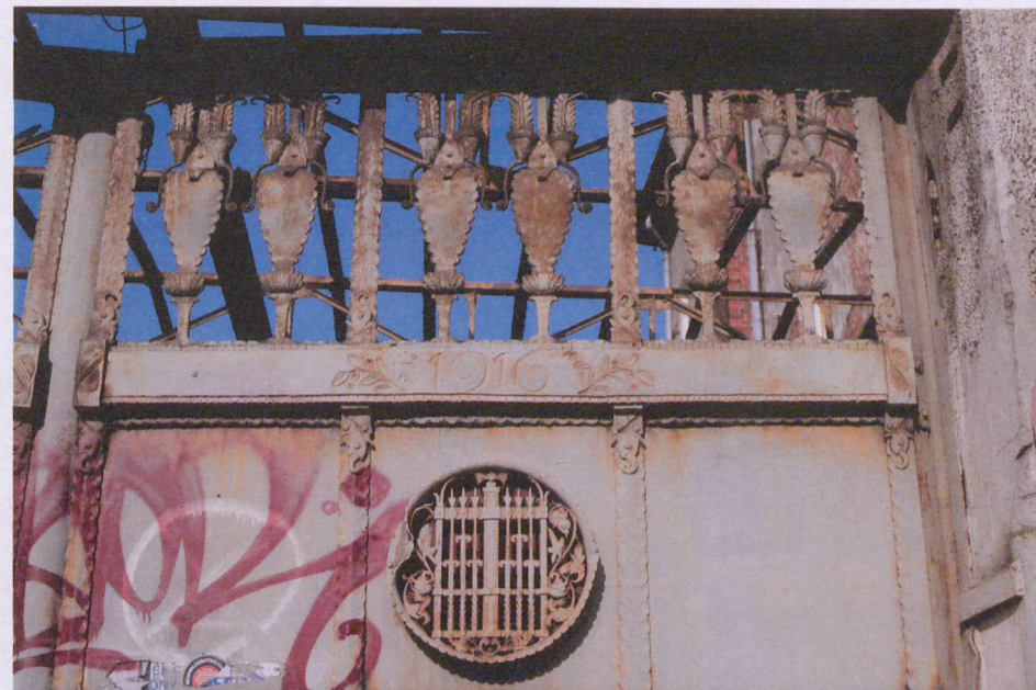
5. Detale prawego skrzydła wrót, fot. 05.2018