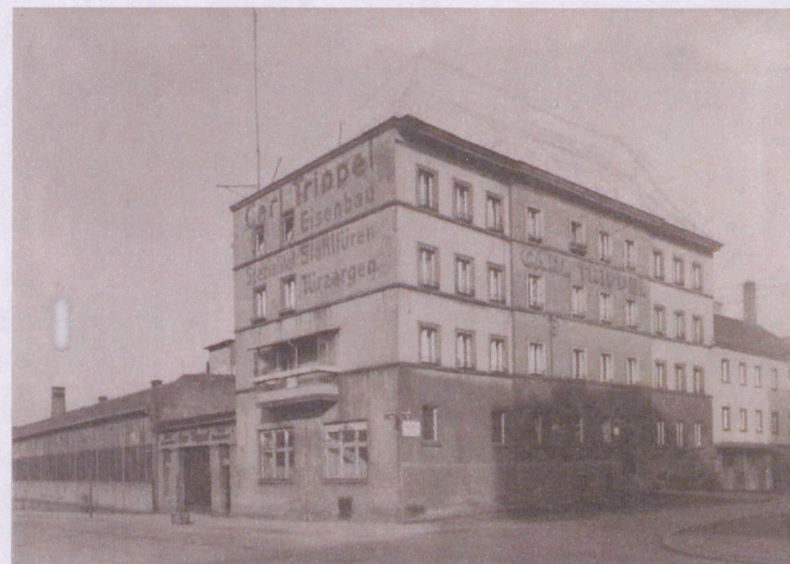
3. Widok od południa, fot. przed 1939