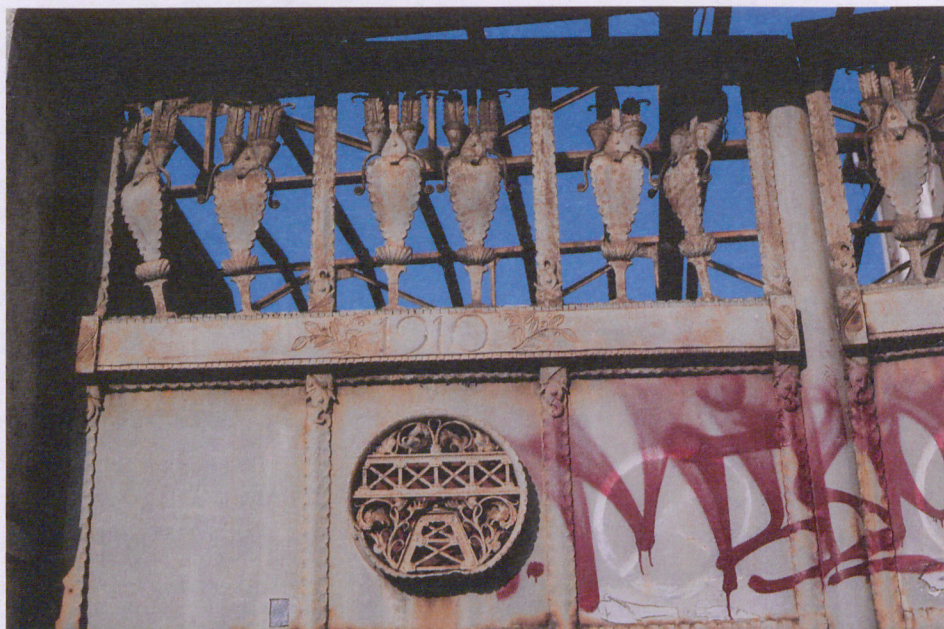
4. Detale lewego skrzydła wrót, fot. 05.2018