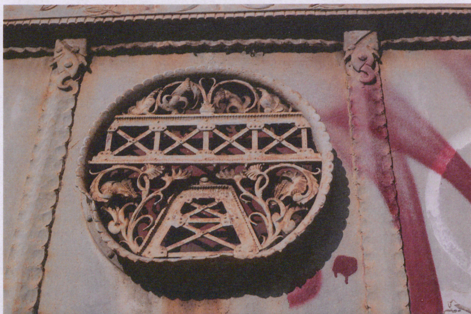
6. Detale lewego skrzydła wrót, fot. 05.2018