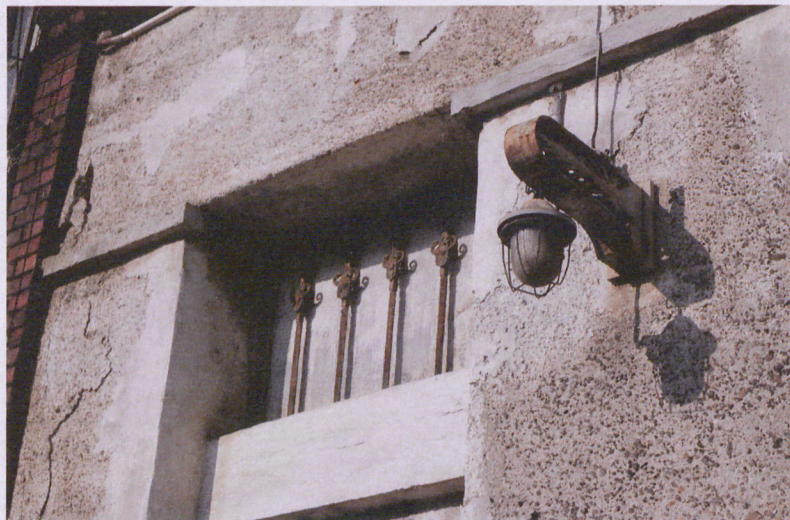
8. Detale elewacji, fot. 05.2018