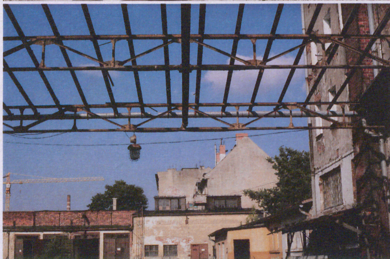
10. Konstrukcja dachu nad strefą wejściową, fot. 05.2018