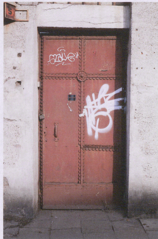
9. Furtka, fot. 03.2018