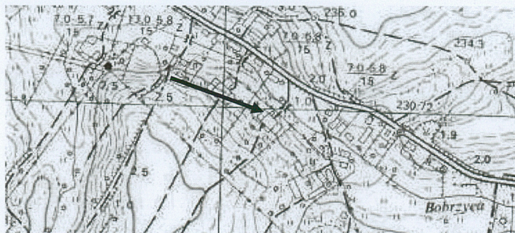
Mapa orientacyjna skala 1:10 000