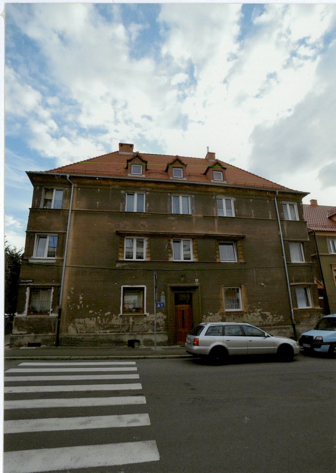
Elewacja frontowa północno - wschodnia