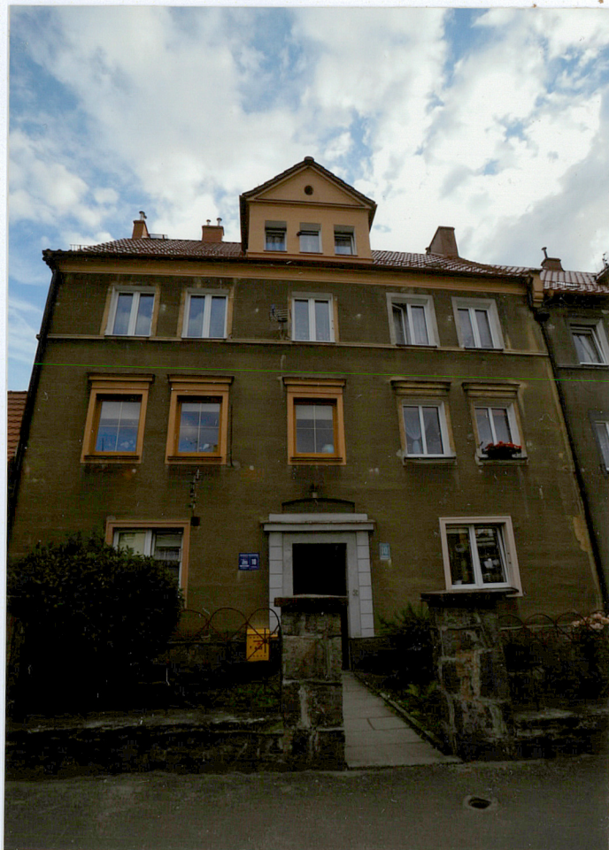
Elewacja frontowa północno - wschodnia