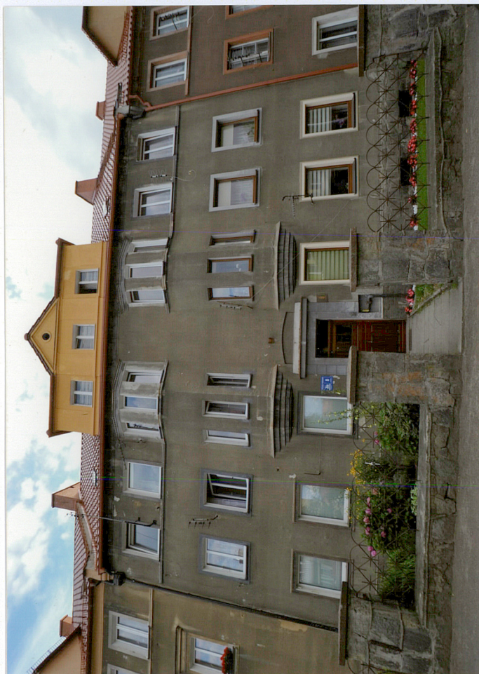
Elewacja frontowa północno - wschodnia