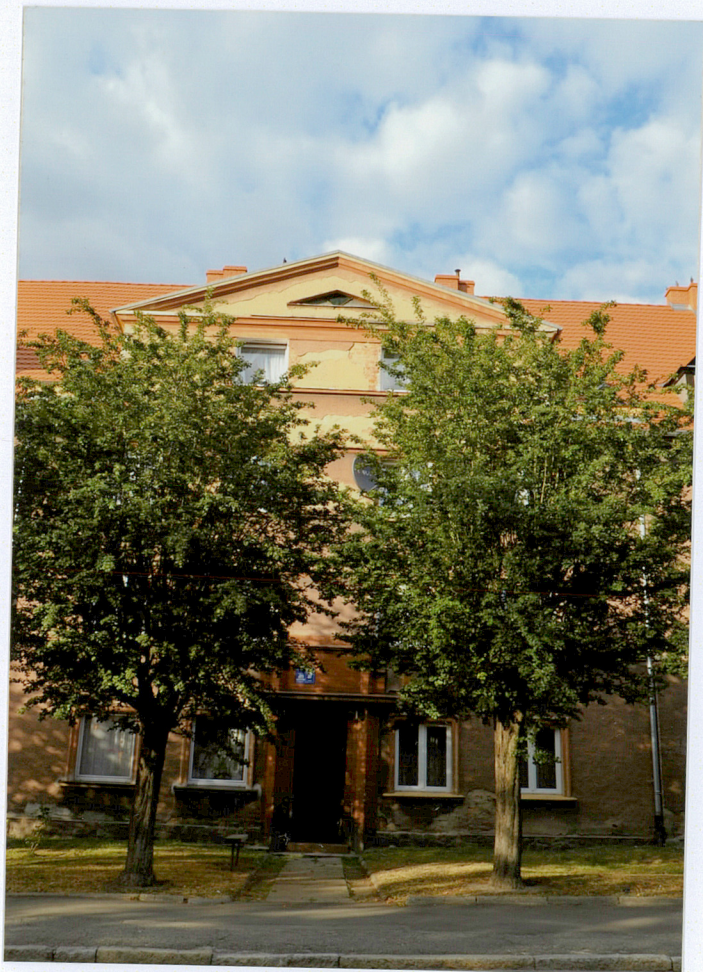
Elewacja frontowa południowo - wschodnia