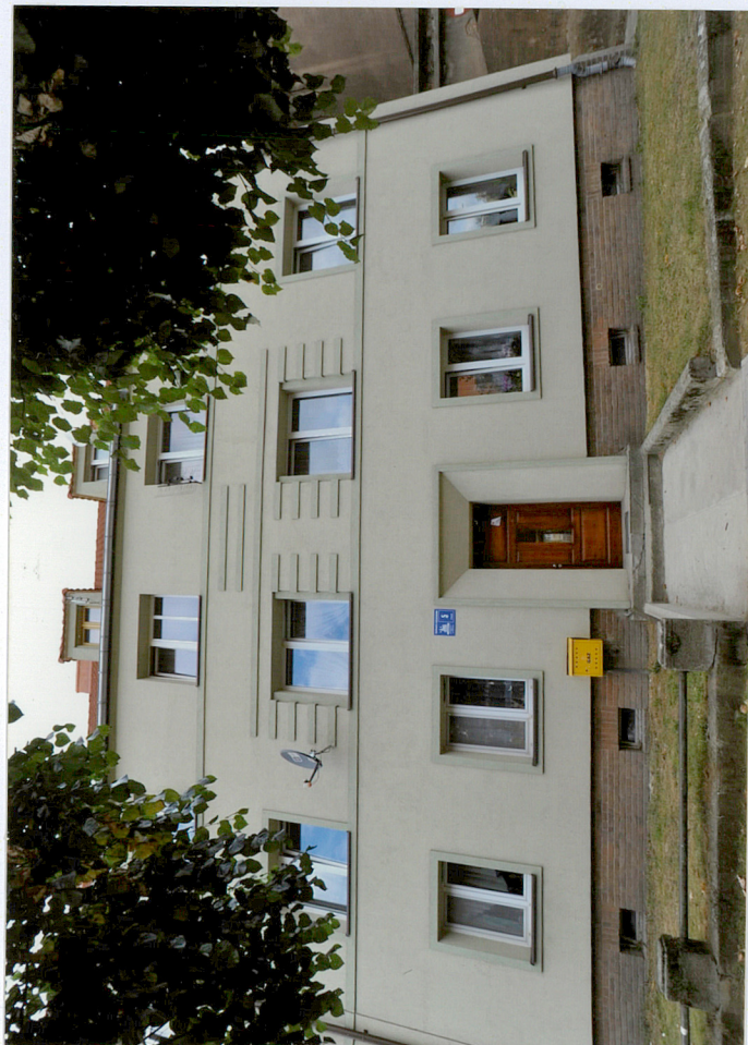
Elewacja frontowa południowo - wschodnia