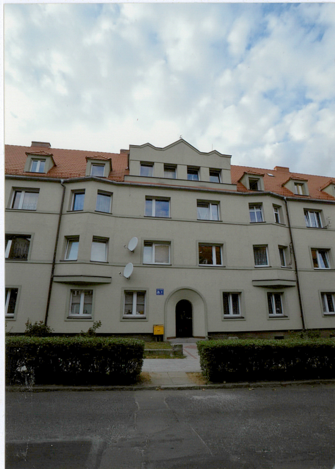
Elewacja frontowa południowo - wschodnia