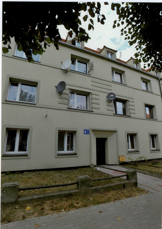
Elewacja frontowa południowo - wschodnia