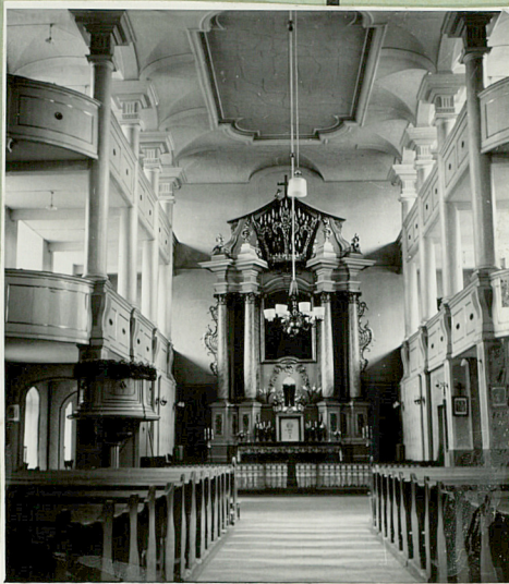
32. Przebieg prac konserwatorskich