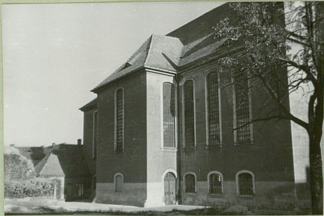
31. Szkic sytuacyjny, plan schematyczny, uwagi opisowe, fotografia