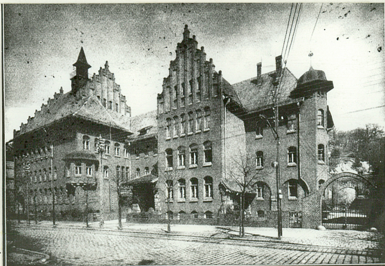
Jedn. PWHz. 1428/S O.Z.Graf.

Monographien Deutscher Städte - Tom XVI - Waldenburg in Schlesien. Berlin 1925 /str. 151/. ↴