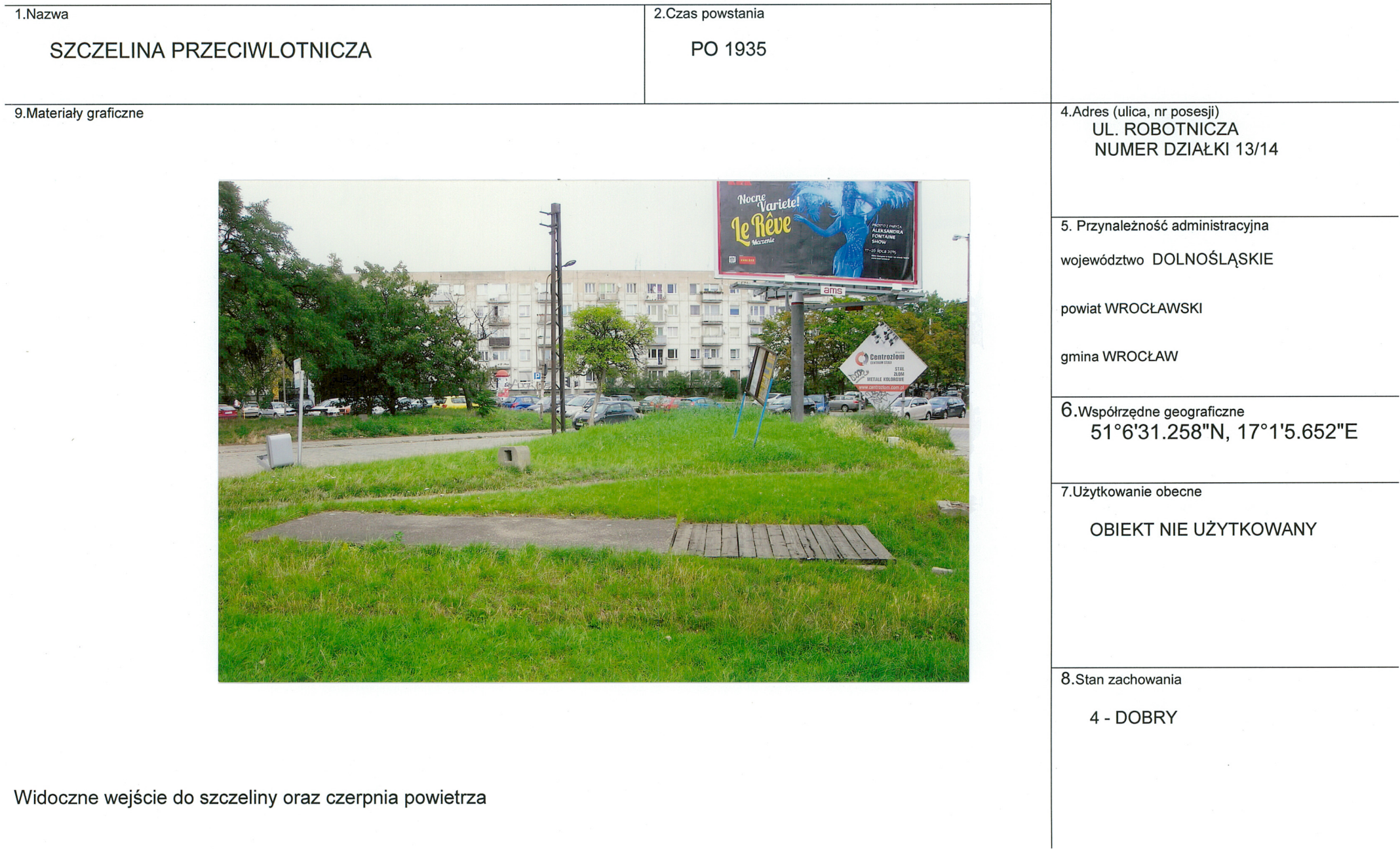
Widoczne wejście do szczeliny oraz czerpnia powietrza