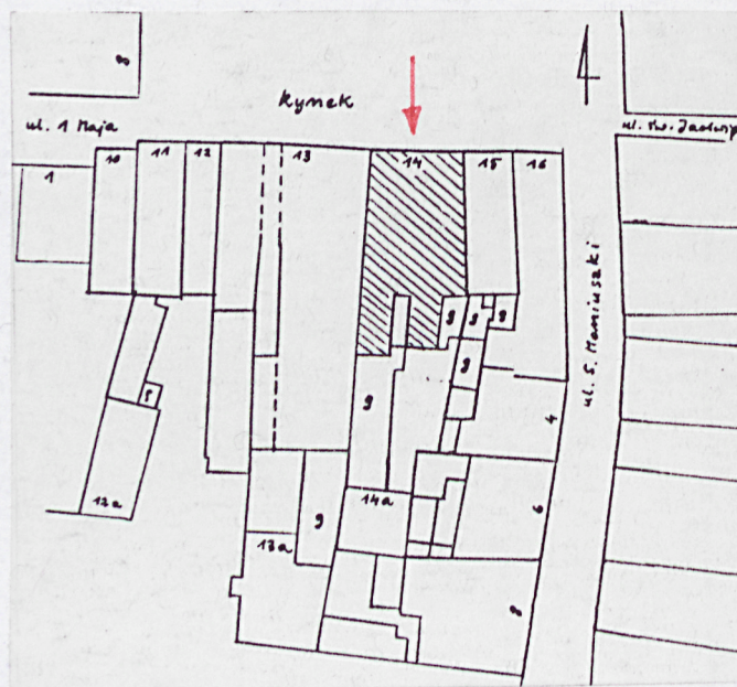
plan sytuacyjny w skali 1: 1000