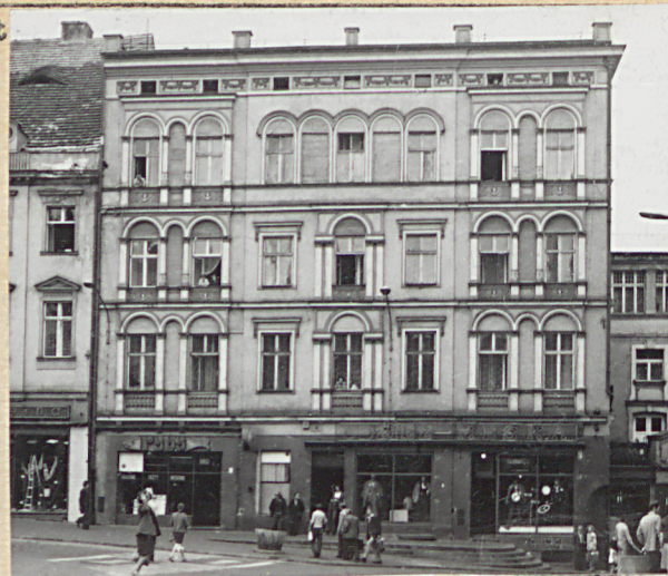
Skrzydło lewe - - II p. tro