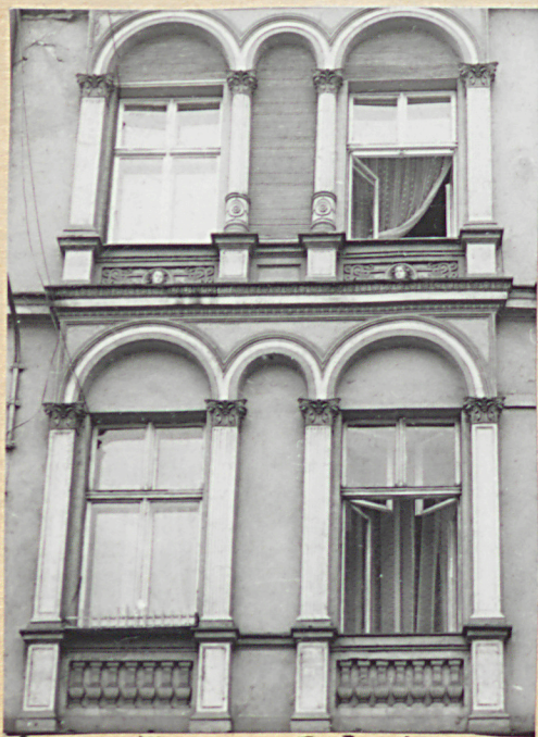
skrzydło prawe - I i II p-tro

KAMIENICA PIERWOTNIE RENESANSOWA, PRZEBUDOWANA W BAROKU / SKLEPIENIA NA PARTERZE, KLATKA SCHODOWA / NA PRZEŁOMIE XIX i XX WIEKU NADBUDOWANO JEDNĄ KONDYGNACJĘ, WPROWADZONO BOGATY WYSTRÓJ FASADY ORAZ POWIĘKSZONO ZAPLECZE SKLEPÓW PRZEZ POŁĄCZENIE ICH Z OFICYNAMI