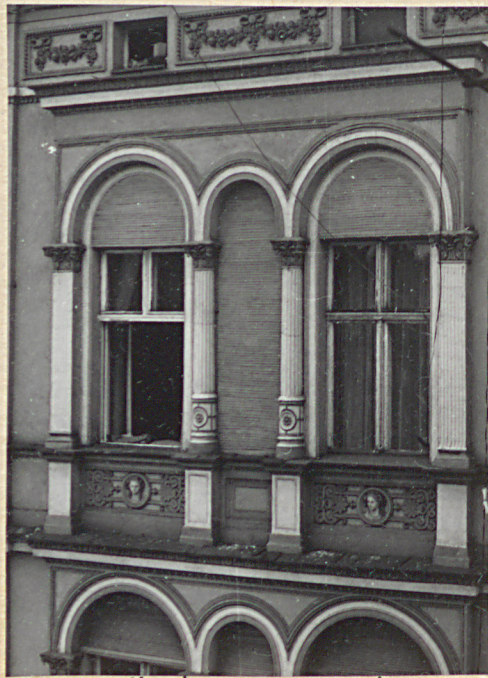
skrzydło lewe - III p-tro

Budynek mieszkalny czterokondygnacyjny, podpiwniczony, narożny w zabudowie zwartej. Parter zajmują w całości lokale sklepowe.