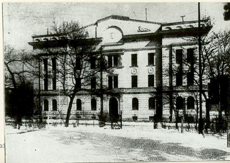
Jedn. PWHz. 1428/S O.Z.Gra

Monographien Deutscher Städte /pr.zbior./ - Tom XVI: Waldenburg in Schlesien. Berlin 1925 - str. 353. ↴