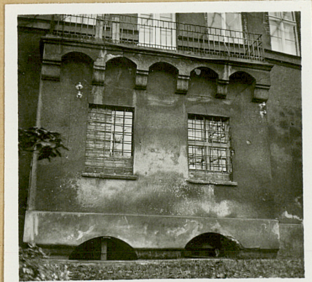
Zjednoczenie - zam. 1858, 18. 11. 57 - 12000 - kart.