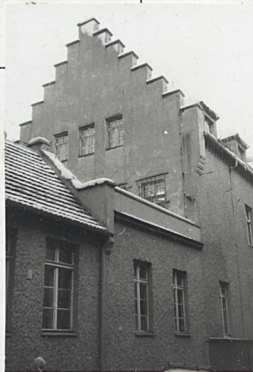
20. Najpilniejsze postulaty konserwatorskie