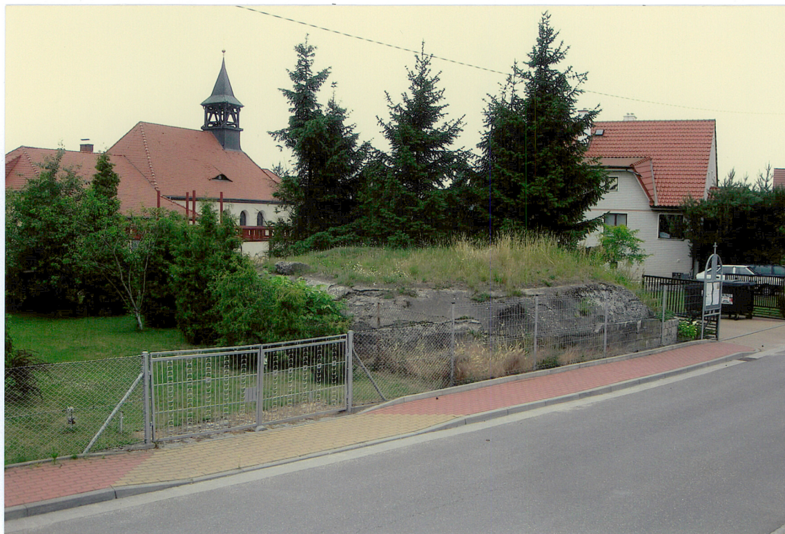
Widok od dawnego przedpola na ścianę czołową.