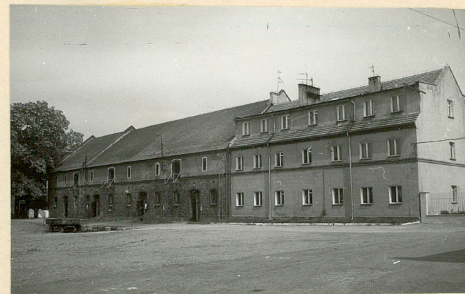
Skrzydło pn - elev. poł.