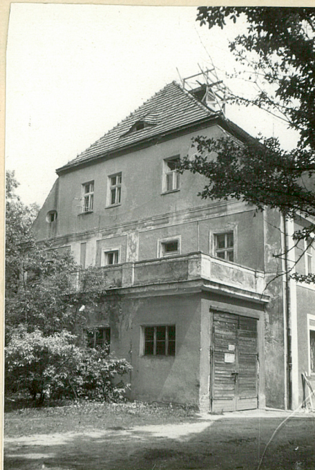
Patac. widok od zach.