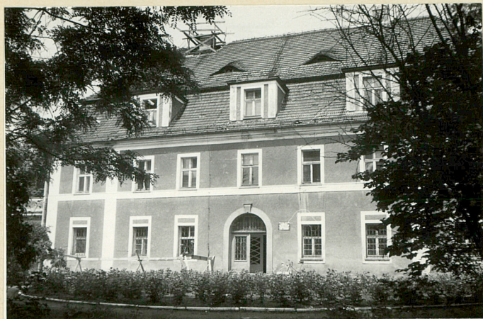
Patac. widok od poł.