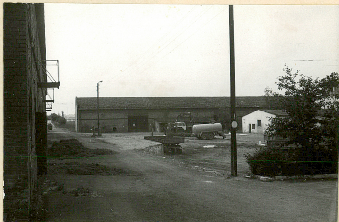
Skrzydło poł - widok od pn.

pomieszczeń piętra pałacu - stawiając ściany działowe, zamurując część otworów drzwiowych i grodząc korytarz.