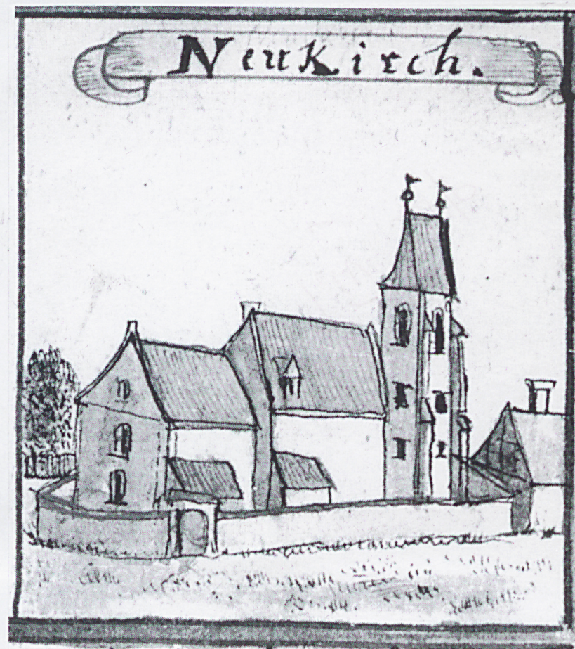
F.B. Wernher, Topographia oder Prodomus Silesiae Ducatus, T.I - 335/P