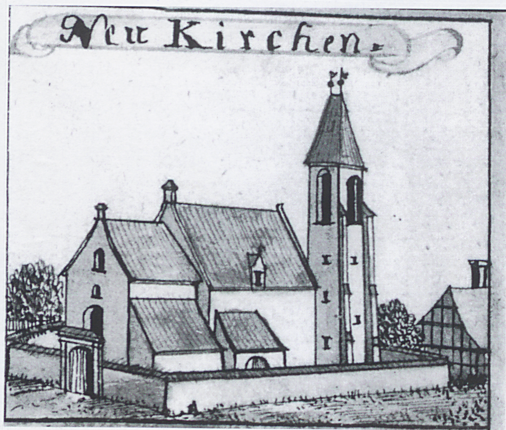
F.B. Wernher, Topographia oder Prodomus Silesiae Ducatus, T.I - 431/P(2)