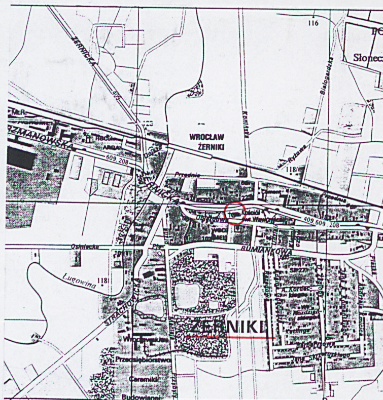
Plan orientacyjny, skala 1:20 000