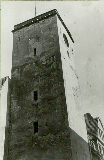
32. Przebieg prac konserwatorskich