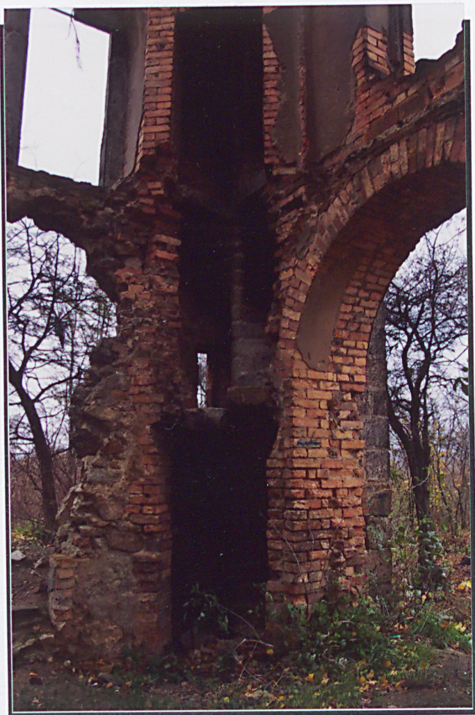
Wnętrze, widok na schody