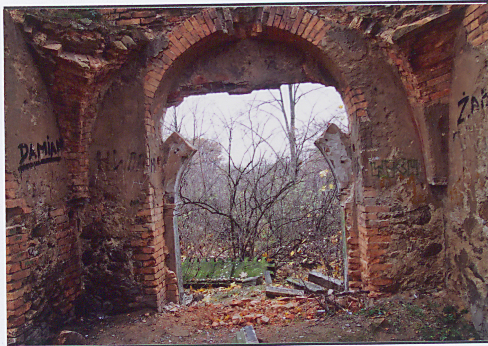
Wnętrze, widok na zniszczone sklepienia