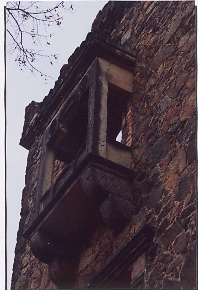
Wykus w elewacji południowej