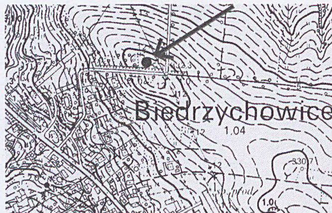
Plan orientacyjny, skala ok. 1:10000