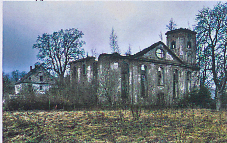
Widok ogólny od strony południowo-wschodniej.