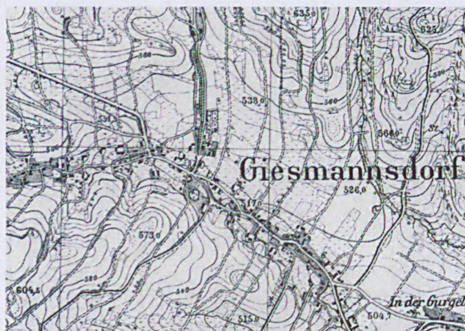
Plan orientacyjny z 1936 r.; skala 1:25 000.