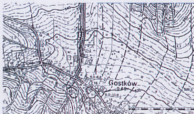
Plan orientacyjny, skala 1:10 000.