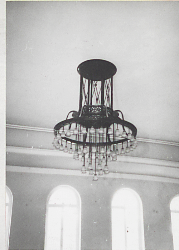
14. Widownia, żyrandol