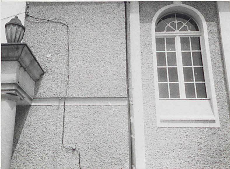
8. Widownia, okno