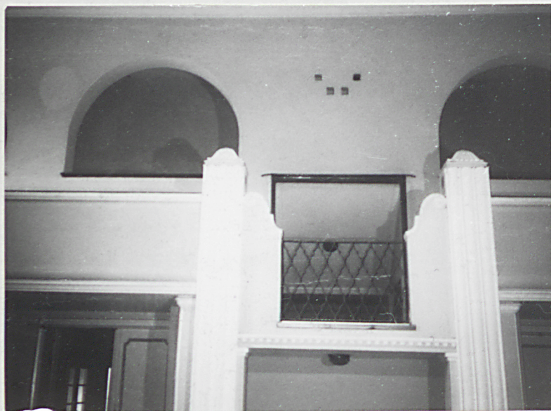
12. Balkon, łóże