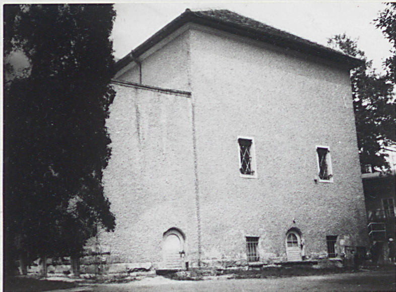
3. Teatr, elewacja pld.-wsch.