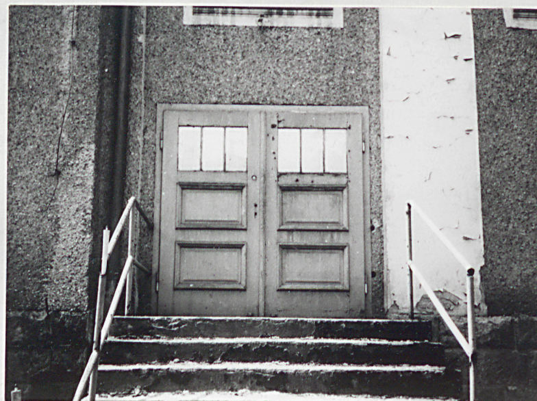
6. Elewacja płn.-wsch., drzwi na widownię