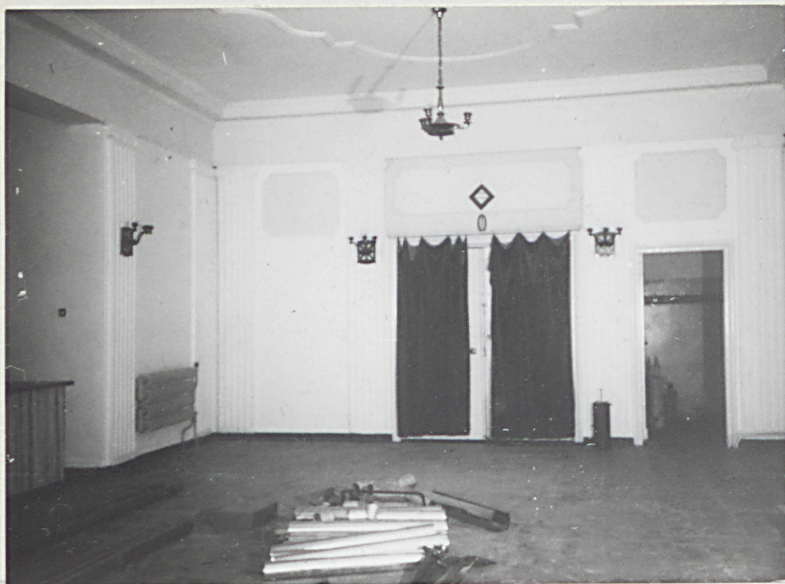
10. Teatr, foyer