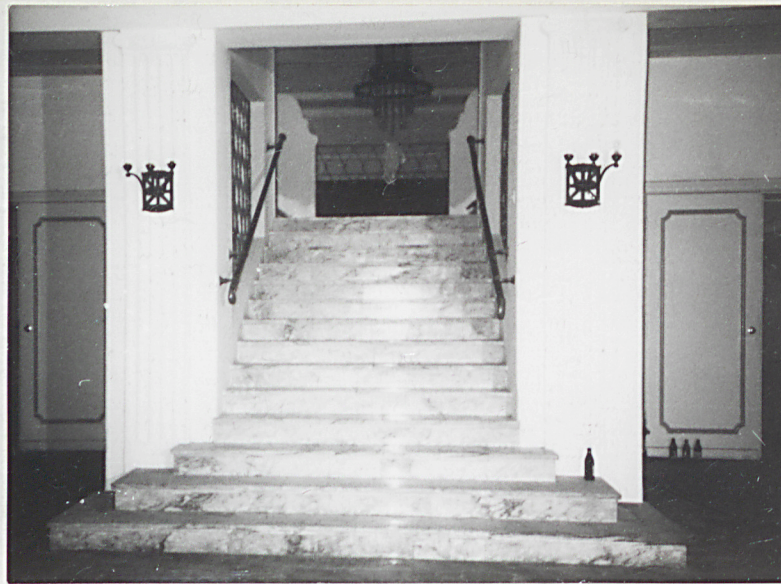
11. Foyer, schody na balkon