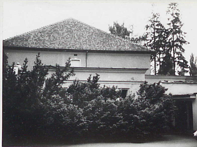
4. Teatr, elewacja, płn.-zach.