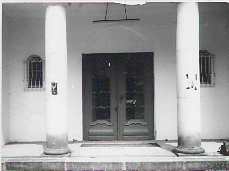
5. Teatr, wejście główne