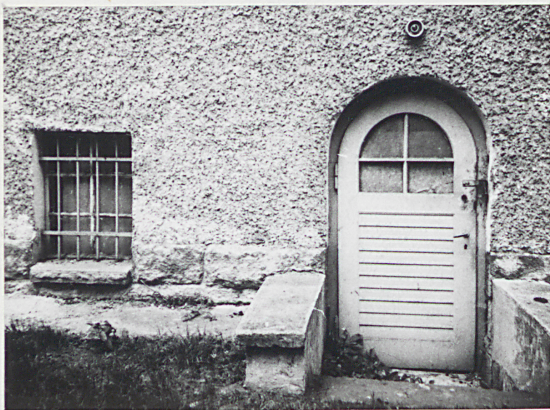
7. Elewacja płd.-wsch., drzwi do piwnicy