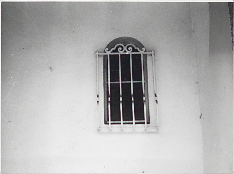
9. Portyk, okno