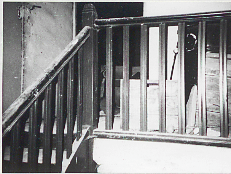
13. Klatka schodowa, balustrada