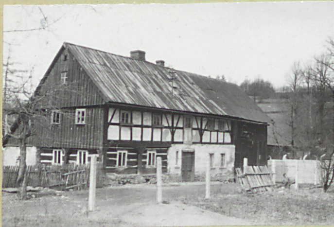
WIDOK OD PŁD.