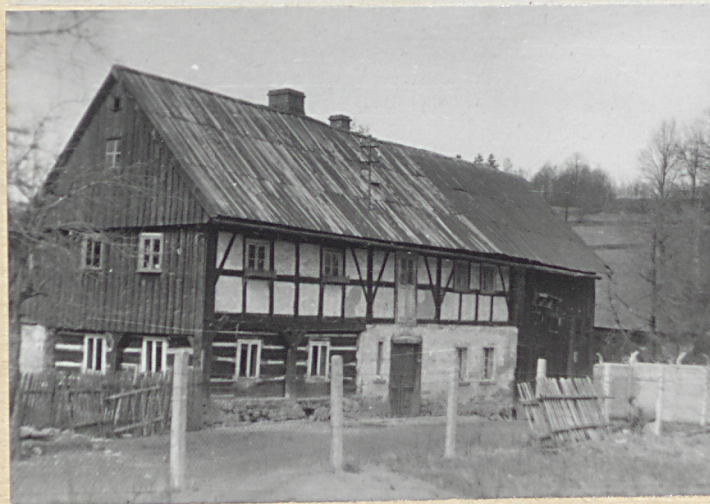
WIDOK OD PŁD.