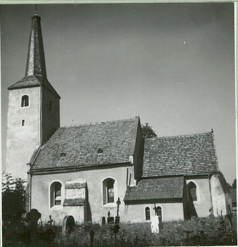
35. Uwagi różne