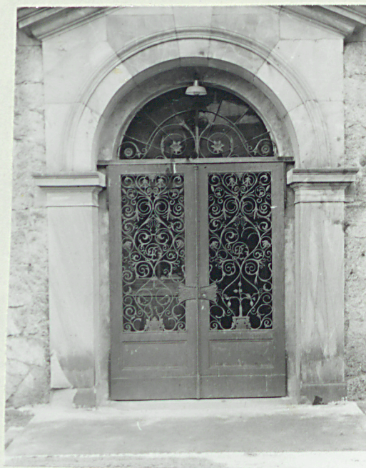
Portal w el.płd.